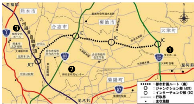
都市計画道路の位置図