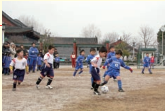
寒さに負けず、元気いっぱいにプレイする園児たち

チャイルドサッカー大会が孔子公園であり、町内外の保育園や幼稚園から合わせて29チーム約300人が参加しました。開式で加茂野伸一郎会長が「けがのないように優勝目指して頑張ってください」とあいさつし、1チーム6人の選手たちは、各コートに分かれて熱戦を繰り広げました。園児たちが、相手をうまく交わしシュートを決めるなど元気いっぱいのプレーを見せると、会場の保護者からは大きな声援が送られていました。上位の結果は次のとおりです。