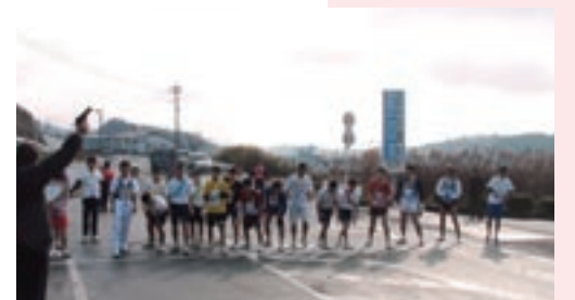
旭志総合支所前をスタートする参加者