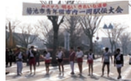
菊池市役所前でスタートを待つ参加者

菊池市役所前をスタート・ゴールとする大会は、明るいきれいな選挙を呼びかけることを目的に、全7区間、28kmのコースであり、9チームが参加しました。上位の結果と区間賞は、表のとおりです。(敬称略)