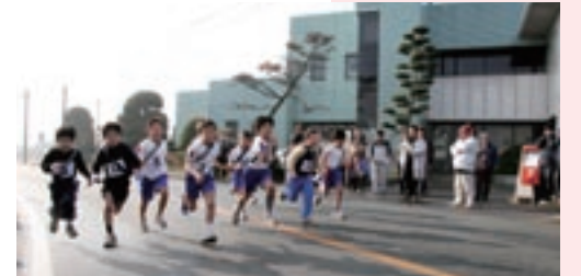
七城総合支所前をスタートする参加者