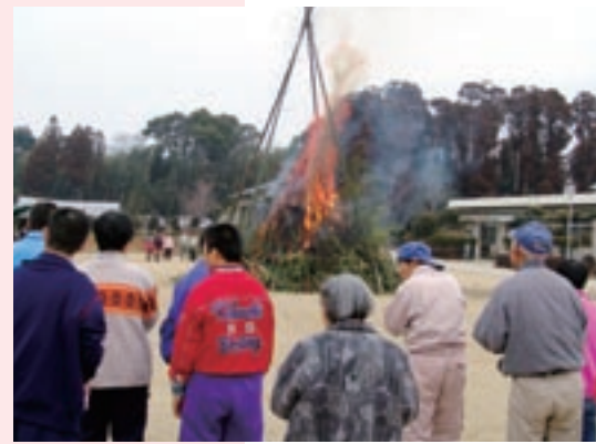
パチパチと大きな音を立てながら燃え上がるどんどやに驚く参加者もいました