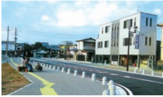
道路のバリアフリー整備は「土木費」に含まれます。

うにするため、一定の基準で国から分配されるんだ。だから財政需要に対して収入が少ないほど厚く配分されて、余裕がある自治体では地方交付税がないところもあるんだよ。 ●菊池市は依存財源が約70%も占めているけど、少し厳しい財政状況なのかしら？ ●財政状況は収入だけでは計れないけど、財政状況を示す財政健全化比率では基準値を下回っていてまだ問題はないよ。だけど自主財源の市税は昨年から4億円ほど減少しているから、注意する必要があるね。 将来のためには、自主財源の確保に努めなければいけないし、貴重な財源を有効的に活用しなければならぬんだ。