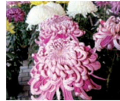
菊まつりに出品された「大輪菊」

初心者向けの料理教室です。いろいろな料理を作って、楽しく活動していきましょう。 とき ・男性限定クラス（初心者向）第1・3火曜日 ・女性限定クラス（初心者向）第2・4火曜日 ところ 菊池市勤労青少年ホーム 会費 月2回で3,000円 対象年齢 18歳以上（高校生不可）上限無し 問い合わせ先 菊池市勤労青少年ホーム ☎（24）1044 ※受付時間は平日の午後3時30分～午後9時。