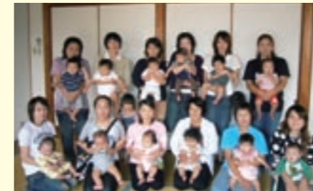
学習に協力した 12 組の親子。学習の趣旨をご理解の上、快く参加して頂き、ありがとうございました

この事業は、思春期の子どもたちが乳児とふれあうことで、命の尊さや子育ての大切さ、母性・父性について考える機会とするため、家庭科の時間を使って、市と中学校の共催で毎年実施しています。