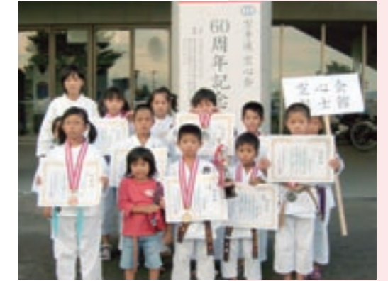
烈士館の子どもたち