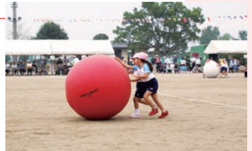
園児による「大玉ころがし」