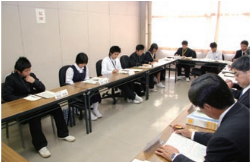
魅力あるまちづくり委員会

ですので、出かけられる際には、一度でも多く路線バスなどの公共交通機関を利用していただきますようお願いいたします。 公共交通機関は、皆さんのものでありますので、自分たちの生活交通は自分たちで守るという意識を持ってご協力いただければと思います。