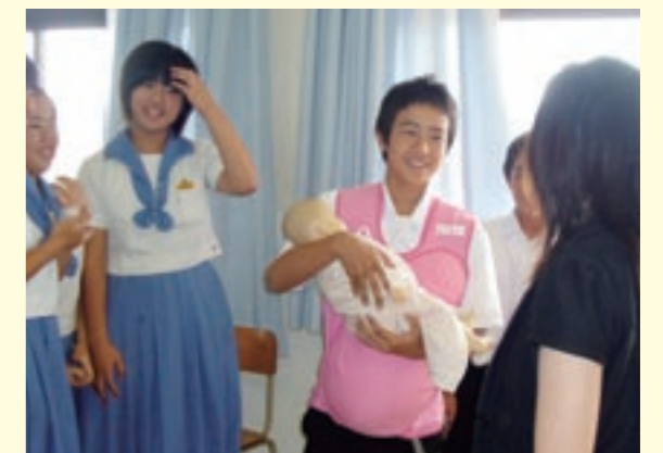
シミュレーターで、自分たちを生んでくれたお母さんの大変さを体験する生徒たち