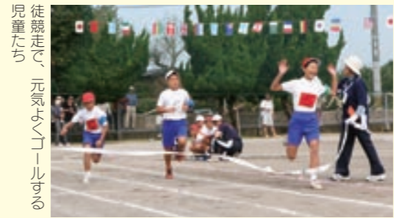
徒競走で、元気よくゴールする児童たち

また、七城小を除く(6月開催)市内の12小学校でも、同時期にそれぞれ運動会がありました。