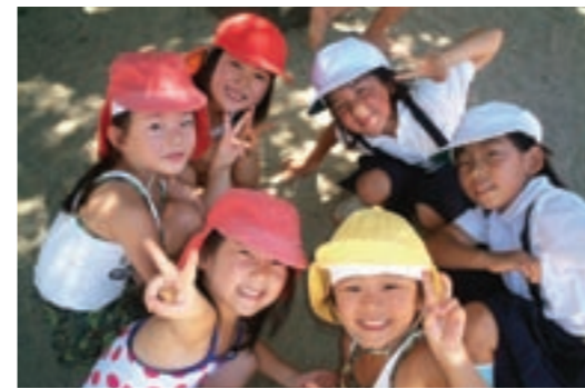
幼・保・小の交流

これまで「菊池市幼・保・小・中連携」の取り組みを進めています。菊池市では、幼稚園と保育所、小学校と中学校では、それぞれ連絡協議機関を設け連絡調整などを行ってきました。また、小学生・中学生と幼稚園や保育園児との交流活動も行ってきました。特に、旧七城町では、すでに幼保小中連携推進協議会を設立し、取り組みを進めて、県のモデル地域となっています。