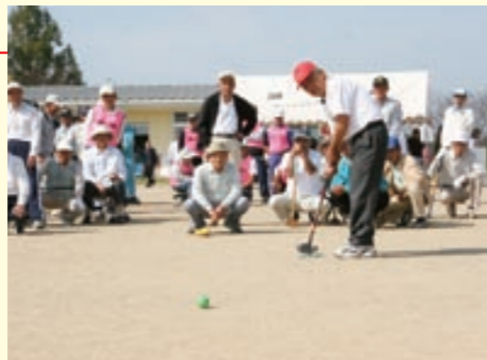
目指せホールインワン