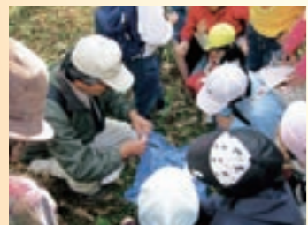
子どもネイチャーゲーム教室