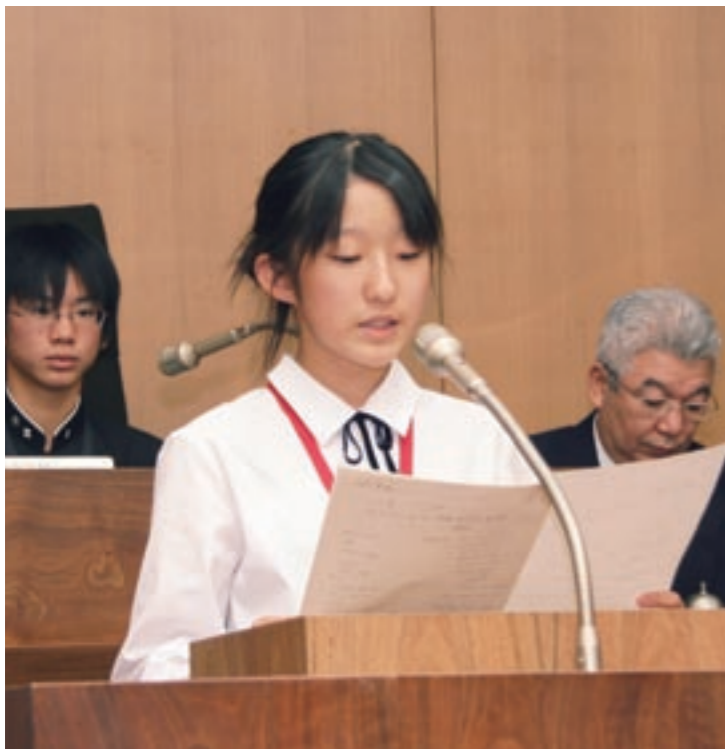
本会議場での委員会報告

答弁▼①それぞれの学校には歴史、伝統や地域性があり、市教育方針を基本にしながらも、これらの特色を活かした学校運営や教育活動を行っていますので、