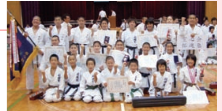
拓魂塾の子どもたち