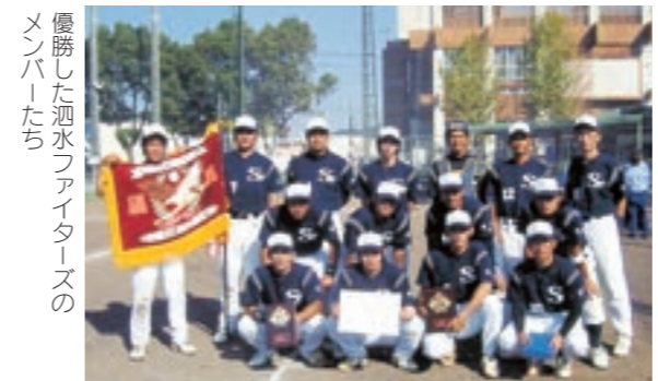
優勝した泗水ファイターズのメンバーたち

試合結果は次のとおりです。 1回戦・織月酒造(人吉市)11-2、2回戦・BOSE・坊主(水俣市)21-3、3回戦・イワイホーム(熊本市)1-0、決勝戦・飛龍クラブ(宇土市)14-0