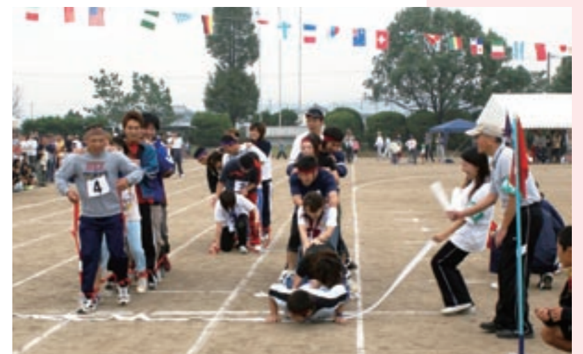
20代・30代による「ムカデでGO」