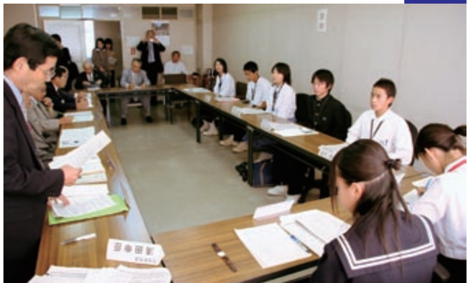
お互いが大切にされるまちづくり委員会

答弁▼小学校での復習学習や選択学習、発展型学習、中学校での学習内容の確認テストや高校入試をイメージしたテストなどについても、各学校で設定されている学力充実の時間や朝の学