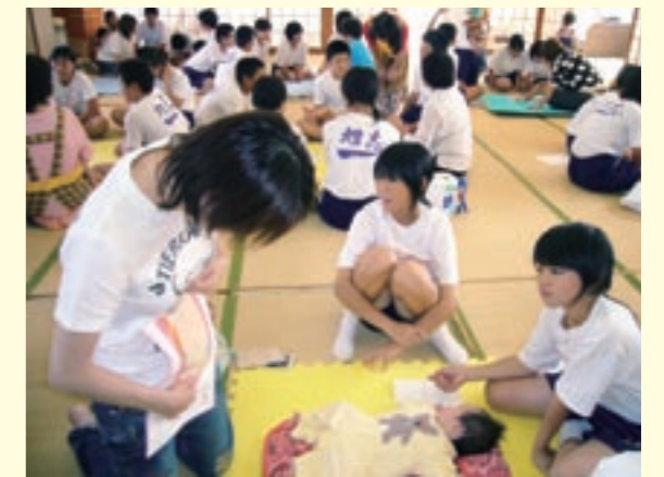
お母さん(左)から、妊娠中の胎児の様子を聞く生徒たち