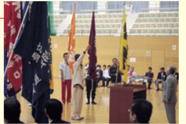
総合体育館であった開会式(選手宣誓)