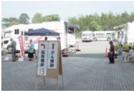
9月～10月に行われた複合健診

市では、9月～10月に行った複合健診の中で、生活習慣病健診を実施しましたが、受診されましたか？