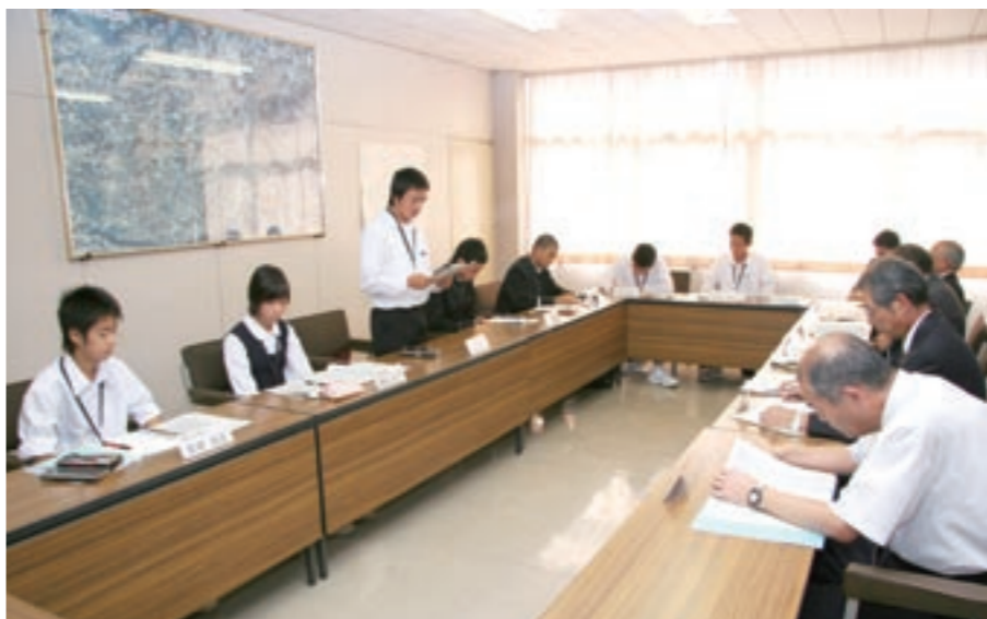
安全に暮らせるまちづくり委員会

今後の取り組みとしては、まず、障害を理解することも必要ではないかと思っております。