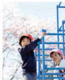
お花っていいにおい。桜の花びらのじゅうたんが、とってもきれいだよ。花ふぶきで遊んでいます。