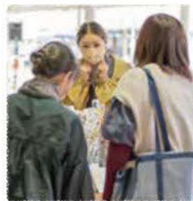
3月20日、市民広場で開催された「きくちさくらマルシェ」