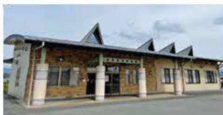
七城多目的研修センター

答弁 平成30年度は乳幼児健診で月に一、二回利用していた。また、つどいの広場では週5日、年間では241回利用していた。