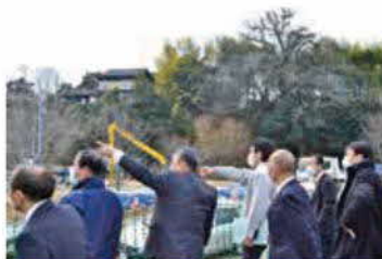
経済建設分科会現地調査 (かわまちづくり事業/玉祥寺)