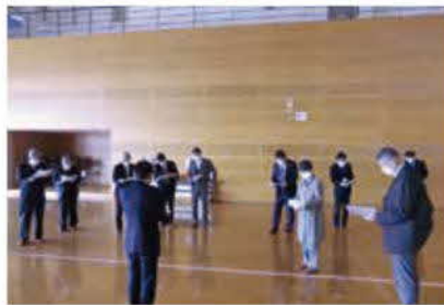
総務文教分科会現地調査 (総合体育館)

答弁 1・2階のトイレで男女ともに1基ずつ洋式化し、洋式化率は23%から38%になる。