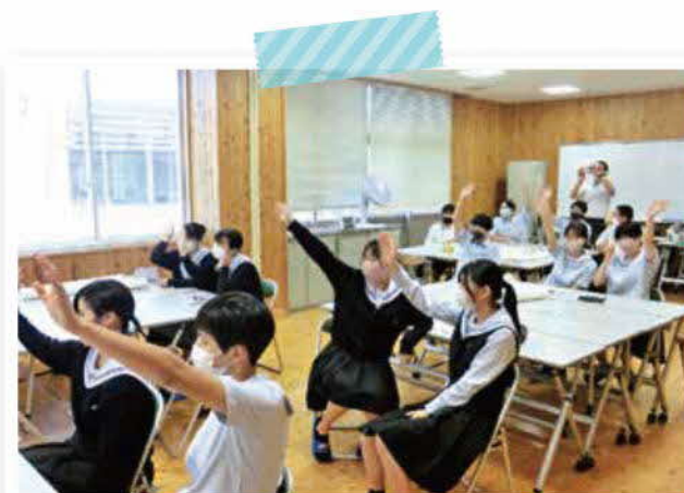
活発に意見を出してくれた「菊池高校3年生」

「SNSを使って発信すると若い人たちも関心を持つのではないか。」といった意見がありました。