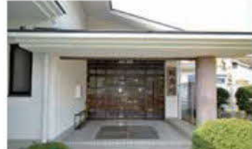
菊池高校セミナーハウス（拓志館）

内容 市内の3高校の魅力化を推進するため、菊池高校セミナーハウス（拓志館）において、市内3高校に在籍する生徒を対象とした、公設の学習塾の運営に要する経費。