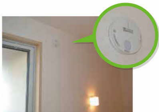
2階の階段に設置した 住宅用火災警報器

Q 農林畜産物のブランド化・高付加価値化を図る本市における「アサリの産地偽装問題」の及ぼす影響と対策は。