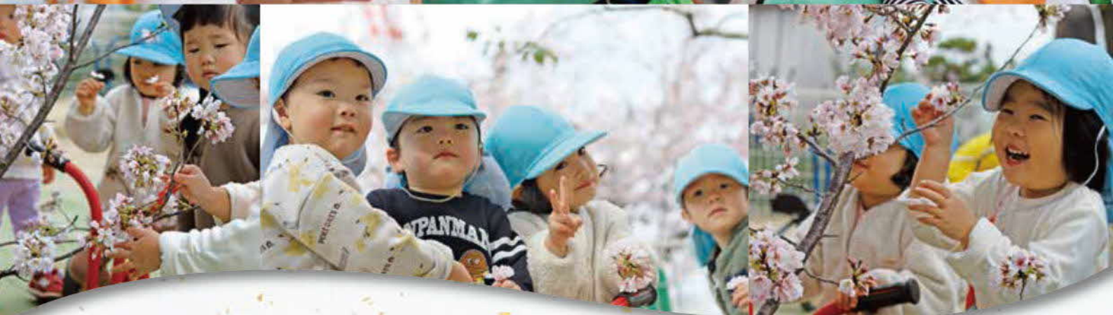
満開の桜の中で… 菊池第2さくら幼楽園