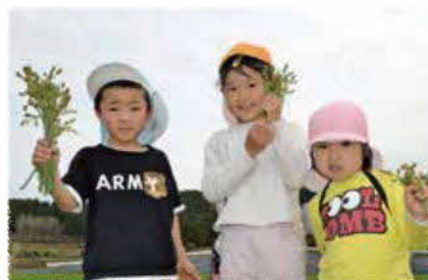
わらび狩りに行って、お花見をしました。いっぱい「わらび」や「つくしんぼ」を取ったよ。