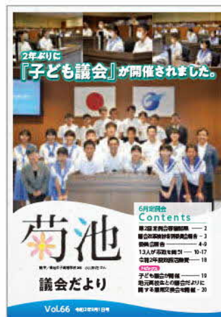
令和3年9月号の表紙