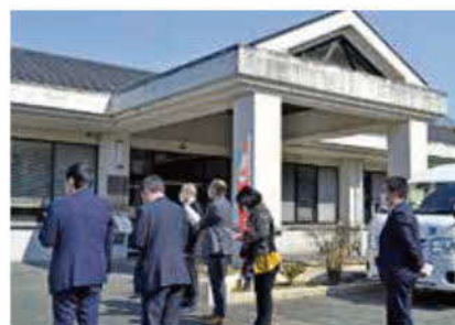
福祉厚生分科会現地調査 (泗水地域福祉センター)

答弁 高齢の親と中年のひきこもりの子どもがいる世帯、家庭内暴力やDV、障がいがあり就労ができず生活困窮に陥る等、複合的な生活課題を抱える世帯に対し、課題解決のための支援を行う取り組みである。現在は、事業開始に向けた準備事業で体制整備等の検討を行っており、令和6年度より本事業移行予定である。