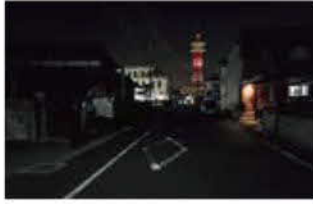
北原・大琳寺／看護学校付近