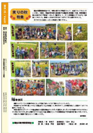
令和3年12月号の裏表紙

そして、前号の令和4年3月号からは、一般質問コーナーの文字数を大幅に削減しました。