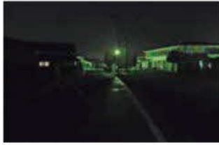
西寺／西部市民センター付近