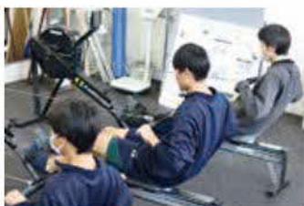
スポーツに励む高校生 (菊池高校 漕艇部)

Q 人口減少対策においてTSMCの進出は大きなチャンスだ。子育て世代の移住定住を図るには、近隣自治体に引けを取らない子育て支援も必要だ。チャンスを生かすため、高校生までの医療費無償化に踏み切るべきだと考えるが、市長の見解は。