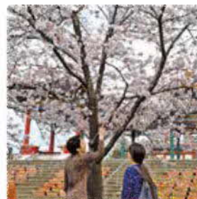
満開の「さくら」と「チューリップ」、隣の養生市場で美味しいお弁当を買って、お花見しま〜す！