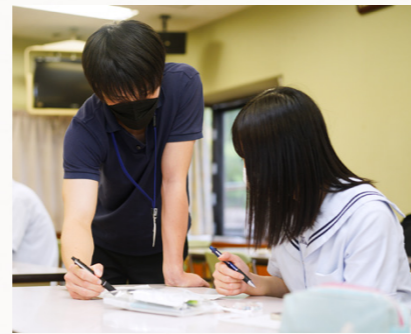
「先生たちが優しく親しみやすい雰囲気です」と話す塾生も