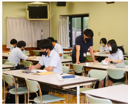
学校の課題を進めたり、苦手科目を勉強したりして、主体的に学習しています