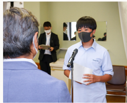
5月9日に行われた開塾式。塾生や関係者ら約100人が参加しました