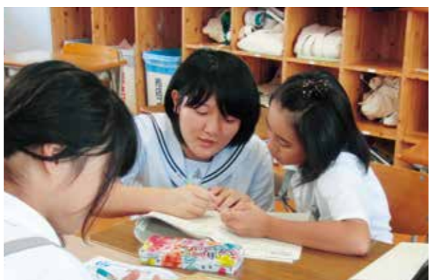
小学生に勉強を教える菊池高校生

菊池高校の教室で、小学生が夏休みの宿題や復習教材などを持ち寄り、菊池高校生が分かりやすく丁寧に教えていました。参加した児童は、「高校生のお兄さんやお姉さんが優しく教えてくれるのでうれしいです」と笑顔を見せていました。