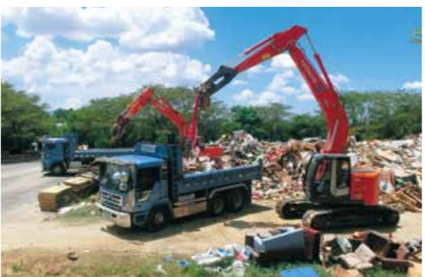
がれきの撤去が始まりました

平成 24 年 7 月九州北部豪雨に伴い発生した災害廃棄物を市内 3カ所に仮置きしていますが、その撤去作業が始まりました。熊本県と産業廃棄物協会の「災害時における廃棄物の処理等の支援活動に関する協定書」に基づき、市も産業廃棄物協会と「実施細目協定」を締結しており、協会のご協力をいただき撤去作業を開始することができました。撤去にはかなりの日数がかかると予想されますが、皆さまのご協力をよろしくお願いいたします。