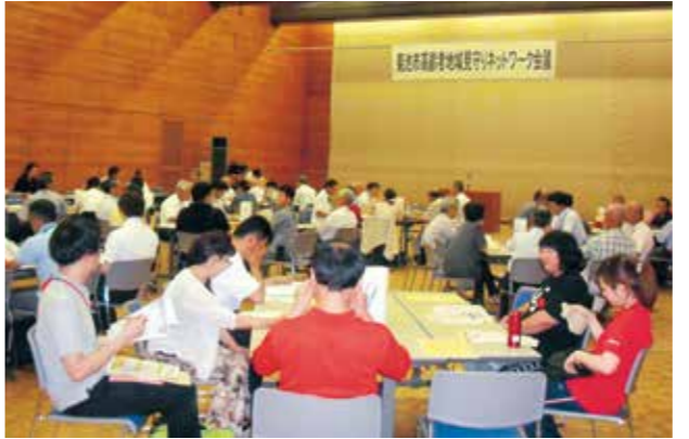
会議に参加した皆さん

菊池市文化会館でありました。当ネットワークは、民生委員、区長、介護施設、タクシー会社、金融機関や新聞販売店などが委員となり、日頃の活動や業務の中で高齢者を見守ることで、高齢者への虐待、認知症高齢者の徘徊、悪質商法被害などの早期発見・早期対応を図ることを目的としています。平成23年度に寄せられた虐待などの相談が123件あったことが報告され、それぞれの役割を確認した後、対応策や課題などについて意見を交換しました。