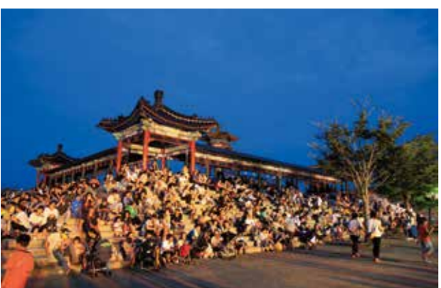
回廊の前でステージイベントを観覧する来場者の皆さん

しすい孔子公園夏祭りは、孔子公園で行われ、多くの来場者でにぎわいました。ステージイベントでは、吉富保育園太鼓や永翔太鼓の演奏のほか、キッズ3B体操や泗水 Jr 新体操クラブなどが踊りを披露。県のマスコット「くまモン」と鞠智城マスコット「ころうくん」も会場に駆けつけ、子どもたちと一緒にダンスを踊るなどして会場を盛り上げました。なお、会場では九州北部豪雨被災に伴う義援金の募金活動も行われ、71,920円が集まりました。