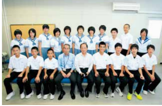
全国大会・九州大会に出場する市内の中学生の皆さん