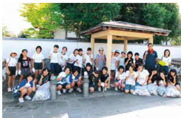
日陰で休憩中の子どもたち。炎天下で清掃作業を頑張りました

参加した子どもたちは、「自分たちが住んでいるまちをきれいにできて良かった」、「空き缶やたばこの吸い殻を捨てないでほしい」などと話し、額に汗を流しながら作業を頑張っていました。