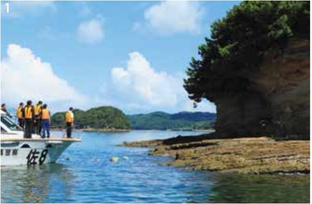
1. 増田巡査が火葬された小松島に献花する佐賀県警の皆さん

洒水町出身の故人・増田敬太郎巡査を祭った佐賀県肥前町高串地区にある増田神社で、増田神社例大祭が開催されました。これは、明治28年に同地区で蔓延したコレラの防疫のために命を賭して尽力した増田巡査の遺徳をしのぶため、同地区の住民が毎年開催しているものです。菊池市からは市議会や洒水町区長会などから多くの人々が参加。漁船の海上パレードや増田巡査の人形を乗せた山車が地区内を練り歩くなど、たくさんの来場者でにぎわいました。