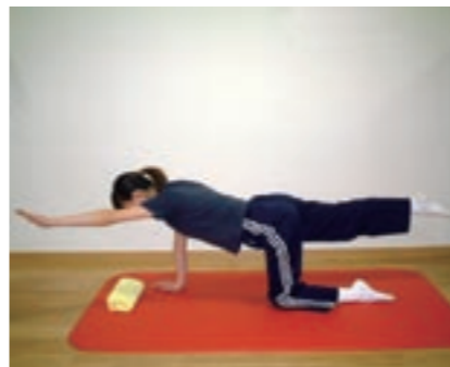
長寿きくちゃん体操「四つ這いバランス」

歳を取ってくると足の力が弱り、ちよっとした段差につまずいたり、骨がもろくなり骨折しやすくなったりします。介護認定を受けている人の原因は、脳卒中に次いで腰痛・関節痛・骨折などが原因で介護が必要となつていきます。いつまでも、自分の足で元気に歩けるように、また、これ以上筋力が低下しないようにするためには、日頃から運動（体操）をすることが大切です。 そこで、菊池市でも転倒予防のための体操「長寿きくちゃん体操」を地域に広めていくために、各地区で活動していただくリーダーの養成講座を開催します。