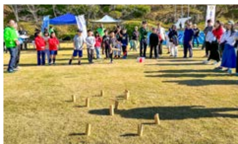
モルックは年齢や性別に関係なく、みんなで楽しめるスポーツです

スポーツ推進委員も審判として運営に携わり、子どもたちのたくさん笑顔を見ることができ、素晴らしい大会となりました。今年も開催予定です。たくさん参加をお待ちしています。