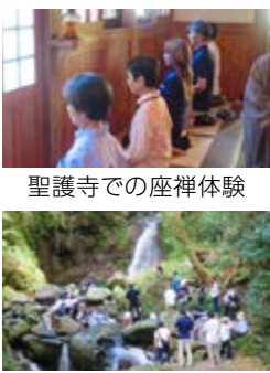
聖護寺での座禅体験

10月11日に、市内の小学生7人、保護者2人、推進員5人が参加し、聖護寺と鳳来の滝に行きました。山道を歩いて、自然を堪能し、聖護寺で座禅体験、滝では水遊びと有意義な時間を過ごすことができました。