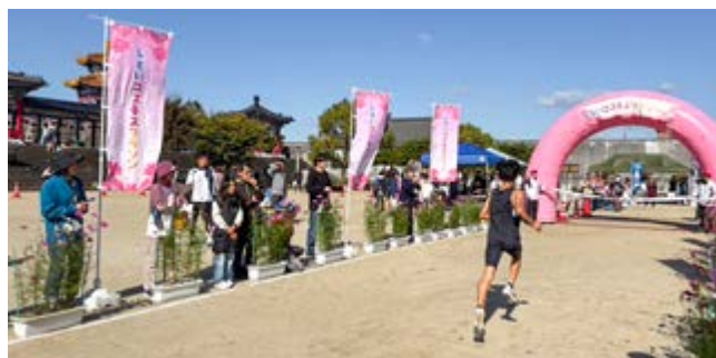
しすいコスモスマラソン大会

11月3日に、しすいコスモスマラソンが開催されました。合志川沿いで、コスモスを眺めながら399人のランナーがゴールの孔子公園を目指して走りまわりました。スポーツ推進委員も運営に協力し、無事に開催することができました。