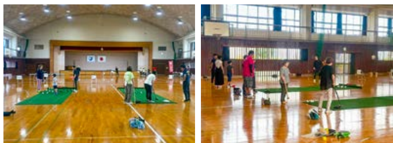
幅広い年齢層の参加者が囲碁ボールやボッチャなどのニュースポーツを体験

スポーツ推進委員会を中心に、各関係団体と連携し、体力測定やニュースポーツを体験してもらいました。参加者からは「楽しかった。また参加したい」といった感想が聞かれました。