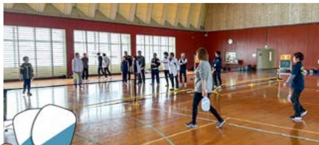
㊤ピックルボールは、テニス・バドミントン・卓球の要素を組み合わせたアメリカ発祥のニュースポーツです ㊦菊池レクはボールで数字が書かれた的を狙う競技

賞会を2月に開催します。かるたのデジタル化も予定されています。菊池の子どもたちだけでなく、市民や市外の人にも菊池の魅力を知ってもらえたらうれしいです。