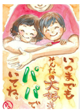
第18回 絵手紙 最優秀作品

認知症を理解するきっかけとして参加してみませんか。要予約。 とき 8月16日(水) 午後2時～ ところ 市本庁舎2階204会議室 ㊦高齢支援課地域包括支援係 ㊨(25)7216