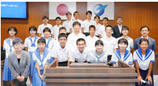
生徒は「本物の議場で質問できて思い出になった。より良い菊池になるよう、もっと政治や選挙に関心を持っていきたい」と話しました

市議会議場で子ども議会が開催され、市内5つの中学校から21人が参加しました。中学生たちは本物の議会のように一般質問を実施。「教科書タブレット化」や「制服の選択制」など、10件を質問したり、提案したりしました。