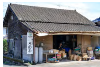
納屋を改造した作業場

こだわった作物を多くの消費者に届けたいと約20年前に株式会社を設立。経営規模を拡大し、農薬や化学肥料などに頼らな