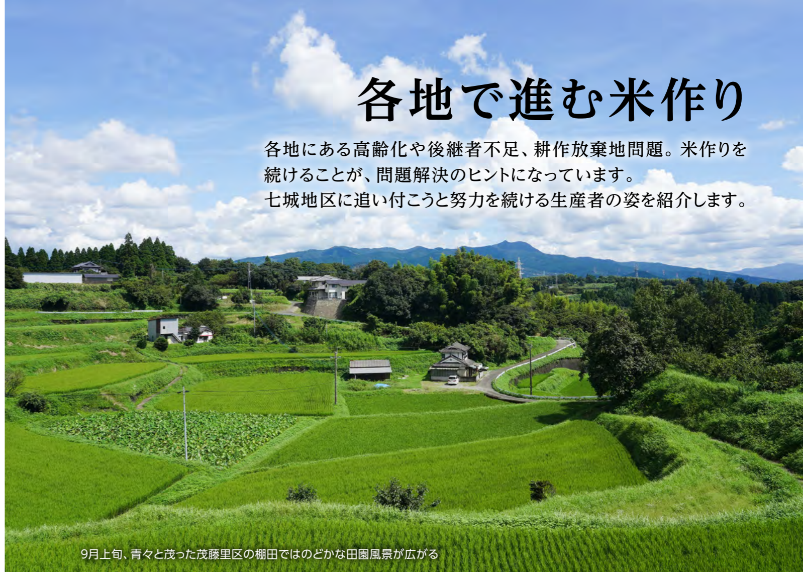
9月上旬、青々と茂った茂藤里区の棚田ではのどかな田園風景が広がる

各地にある高齢化や後継者不足、耕作放棄地問題。米作りを続けることが、問題解決のヒントになっています。七城地区に追い付こうと努力を続ける生産者の姿を紹介します。