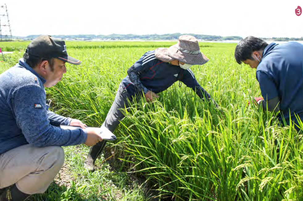
1_毎年4月ごろに咲き誇るレンゲ 2_6月末ごろには田植えが始まり、総会で決めた品種の苗を次々に植えていく 3_9月上旬に行った稲の生育調査。組合員の田んぼを調査し数字を記録する