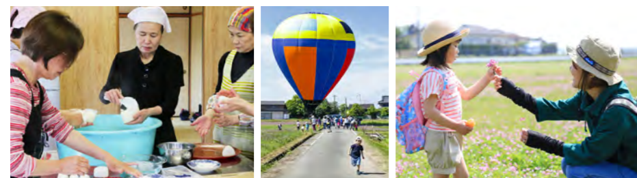
七城加恵れんげ祭りに合わせ、炊き出し訓練も行っている。祭りには気球やパラグライダーも登場。空からお菓子が降ってくる演出もあり、区内外から多くの親子が訪れていた

※集落営農組織 集落を単位として、農業の生産過程の一部または全部を参加者の合意の下に共同化・統一化した営農組織