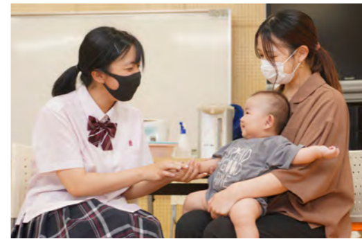
肌に直接触れることで幸せホルモンと呼ばれるオキシトシンが分泌されるといわれています。

家庭科は2年次から保育者コースを選択できます。写真はベビーマッサージで赤ちゃんをコミュニケーションをとっている様子です。マッサージされる赤ちゃんが笑うと、周りも自然と笑顔になっていました。