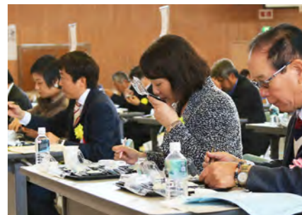
食味コンクールで官能審査を実施する審査員。一つ一つ慎重に審査する

他にも、食味コンに多くの市民を巻き込もうと市独自の資格「菊池市米飯官能鑑定士」の認定も進めました。「菊池米食味コンクール」では認定された鑑