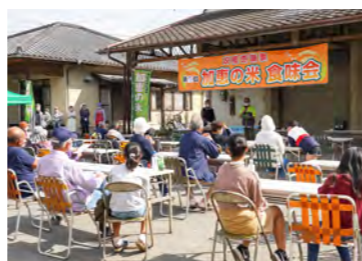
加恵区公民館前で食味会も実施。地域のにぎわいにつながっている