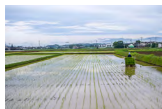
6月末に田植えを実施

ませんでした。組合で作業を教わり、助けてもらいました。各自の得意分野を生かして作業の割り振りをしています」。井戸方区や糠泉区などの人も組合に入っており、米作り以外でも協力の輪は広がっています。コロナ禍で今は開催できませんが、飲み会の場で米作りの意見や情報共有することも多いと話します。「九州各地の営農組合にも研修に行っています。地区外から、高齢化などでコメが作れなくなった土地での米作りの依頼もあります。組合で話し合いを引き受けています。組合のメリットを生かし、無理せずできることをできるしこやっています」。組合として、今後も継続できる米作りを進めていきます。