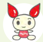
献血推進キャラクター けんけつちゃん「チッチ」