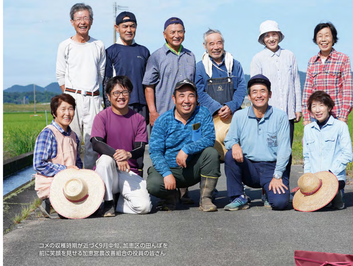
コメの収穫時期が近づく9月中旬、加恵区の田んぼを前に笑顔を見せる加恵宮農改善組合の役員の方

鎌倉中期、8代・菊池能隆の子、隆時が加恵を称したと伝わる地であり、昔から米どころとして知られている七城の加恵区一。生産者同士が協力して組合を作り、米作りとともに地域づくりが進んでいます。