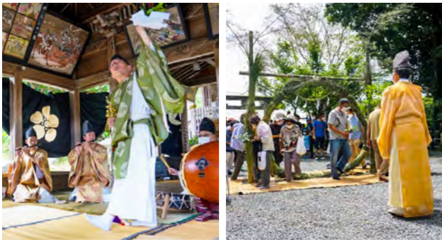
岩本菅原神社の夏祭りでは、茅の輪くぐりも行われました。神楽は、隣の姫井区にある乙姫神社でも奉納されました

毎年7月25日は岩本区の村社である菅原神社の夏祭りの日で、神楽が奉納されます。岩本神楽は約150年前から続けられ、市の無形民俗文化財にも指定。約50人の区民が見守る中、「神」と「地固」の2座が舞われました。