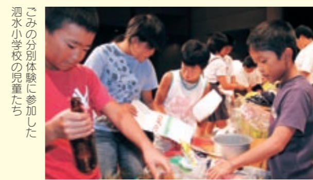
ごみの分別体験に参加した泗水小学校の児童たち