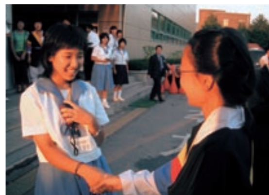
現地の中学生と交流する参加した生徒

菊池市内の中学生の代表 40 人が韓国への海外派遣事業に参加し、外国の歴史や文化を学ぶことができました。