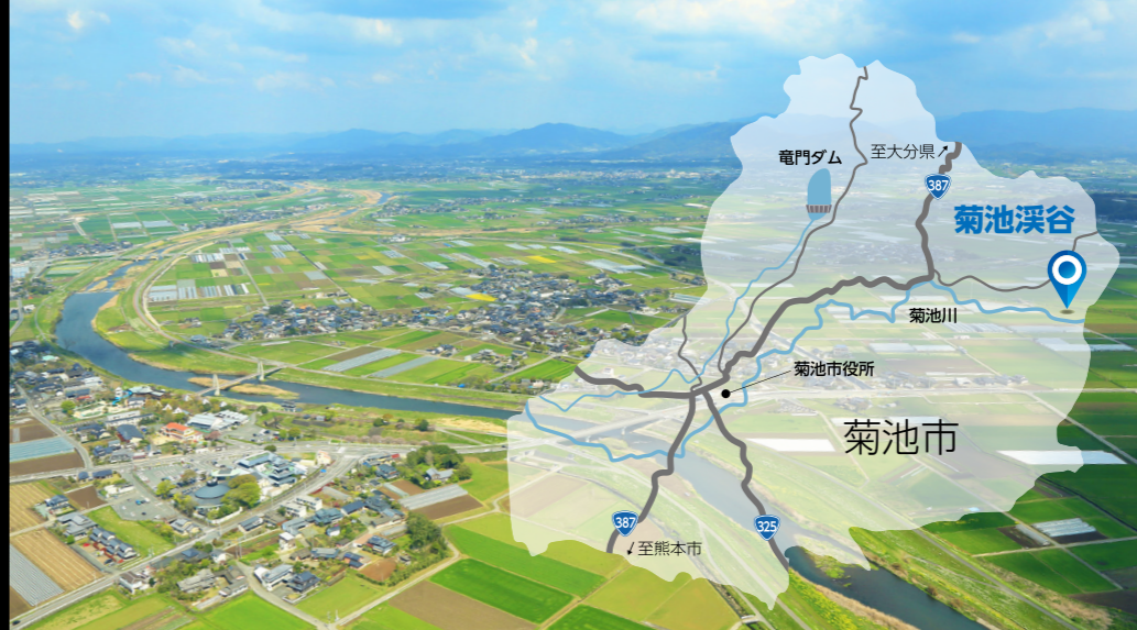
肥沃な土壌をつくってきた菊池川

国民年金加入後の流れ 年金手帳が届きます 年金手帳は、年金の加入制度が変わったときや年金の請求手続きなど、一生涯使用しますので大切に保管してください。