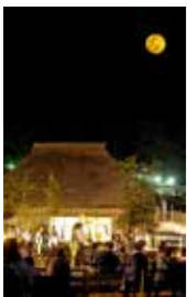
西米良村で毎年秋に開催される「月の神楽」

このことから、1983(昭和58)年10月に、旧菊池市と姉妹都市を締結。本市が2005(平成17)年3月に市町村合併し、2006(平成18)年4月8日の合併1周年記念式典で、改めて姉妹都市を締結しました。 隔年で市から市民交流団を派遣。伝統行事や文化、菊池一族との関係について学んでいます。