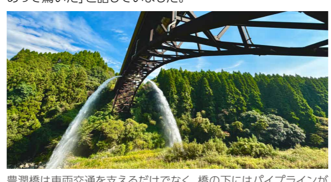
豊潤橋は車両交通を支えるだけでなく、橋の下にはパイプラインが設けられ、農業用水を供給する役割も担っています。放水は菊池台地用水土地改良区が毎年、稲刈りを終えた時期に実施しています

重味地区の菊池川に架かる豊潤橋で年に1度の放水があり、落差38メートルの壮大な水のアーチが市内外から訪れた約100人を楽しませました。見学者は「想像以上に迫力があって驚いた」と話していました。