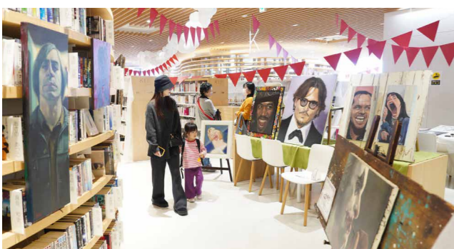
当日は菊池高生が中心となってペイントしたアートバスの完成披露会も行われました

NPO法人「菊池まちづくり千年の風」が主催するアートイベント「ハミダス美術館」が市生涯学習センターキクロスで開催され、県内外のアーティスト26人が参加。多くの来場者でにぎわいました。