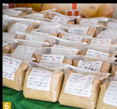
第11回菊池米食味コンクール