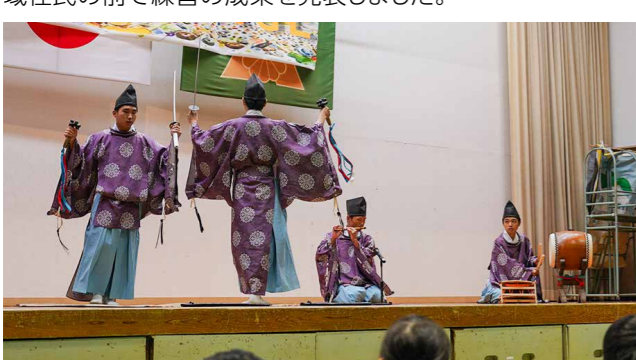
発表会の後半には、生徒有志によるバンド演奏も披露。生徒、保護者、地域住民と一緒に盛り上がりました

旭志中学校の3年生が地域住民から「円通寺太鼓」「湯舟神楽」など、3カ月にわたって伝統芸能の手ほどきを受け、学習発表会で披露。「ふるさと再発見」をテーマに保護者、地域住民の前で練習の成果を発表しました。