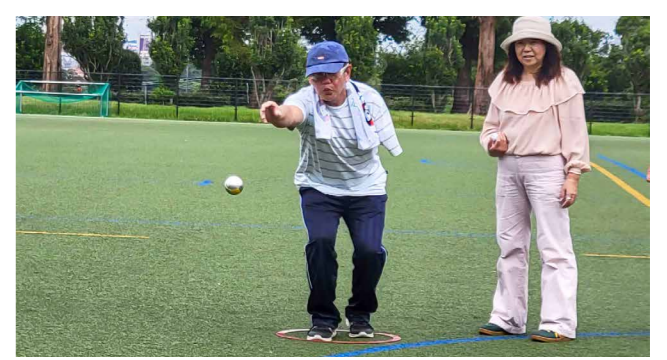
フランス発祥のペタンクは、木製のピュット(目標球)に金属製のボール(ポール)を投げ合って、得点を競うスポーツです

県民総合運動公園スポーツ広場で「第7回くまもと障がい者ペタンク大会」が開催され、市からは3チーム・9人が参加しました。大会では巧みなコントロールで得点を獲得。惜しくも入賞は逃しましたが、白熱した試合となりました。