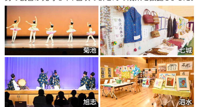
各会場では、作品展示や茶道の御手前、子ども生け花体験などの他、舞台上では吹奏楽やコーラスなどが披露されました

10月27日に泗水ホールで4支部合同開会式・前夜祭が行われた後、10月27日~29日に泗水支部、11月2日・3日に旭志支部、4日・5日に七城支部と菊池支部が、各会場で大勢の観客が見守る中、日頃の研さんの成果を披露しました。