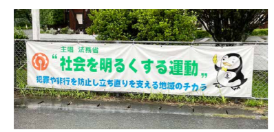
7月に設置した横断幕

各区の協力で7月の強調月間中に設置しました。市役所や市内中学校では、懸垂幕や横断幕を設置して、啓発活動に取り組みました。