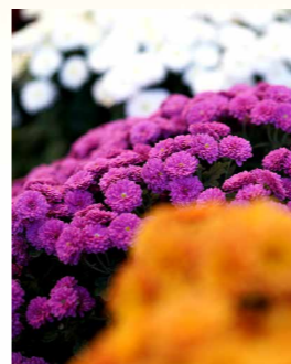
菊人形・菊まつり 撮影:広報(令和5年11月)

●子ども囲碁・将棋教室・大会 ~判断力・集中力を身につける~ (6月~3月・全10回、旭志) 小学1年~6年の18人が、月に1回、3人の指導者から将棋を学んでいます。集中する真剣なまなざしは、未来の棋士かも。大会に向けて、メンバーと対戦して勝ったり負けたり涙したり、楽しく活動しています。