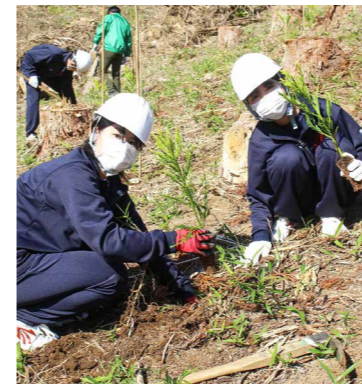
初めて植樹を体験しました

本校では、「菊池高校育友会林」を活用し、菊池少年自然の家の西南一帯で、スギやヒノキを育てています。これまで多くの育友会と卒業生の皆さんが整備され、今でも美しい森が保たれています。また、本校の校舎の木造の部分には、ここで育ったスギやヒノキが使用されていて、生徒たちの成長を見守ってくれています。育友会林では、毎年1年生が11月に「育友会林体験学習」を実施し、環境保全の手伝いを行い、管理に協力しています。昨年も11月1日に、1年生がこの伝統を受け継ぎ、菊池森林組合の皆さんのご指導の下、植樹や整備を行いました。 生徒たちは、ベンチと校訓「汗と夢」の看板作成班と植樹班に分かれて作業。日頃体験することができない林業に触れたり、大自然の中で昼