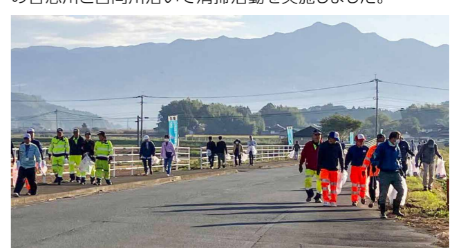
当日は早朝から127人が参加。河川沿いを歩きながら、約10kgのごみを拾い集めました

私たち一人一人が県の宝である水資源を守り抜くという意識を高めるため、平成14年度から川辺の県下一斉清掃活動に取り組んでいます。今回、本市では泗水東小学校周辺の合志川と日向川沿いで清掃活動を実施しました。