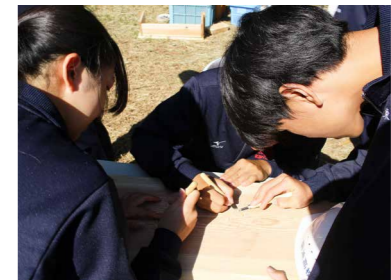
校訓「汗と夢」の看板づくり

食を取ったりし、クラスの団結力も高まったようでした。楽しみながら達成感を感じることができ、貴重な経験になりました。 育友会林の近くを通った際は、本校を思い出してもらえると幸いです。