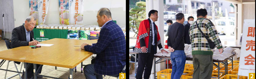
第11回菊池米食味コンクール