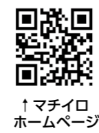
↑マチイロ ホームページ

マチイロとはいつでもどこでも広報紙を読むことができるスマートフォン用無料アプリです。 ☎ https://machihiro.town/