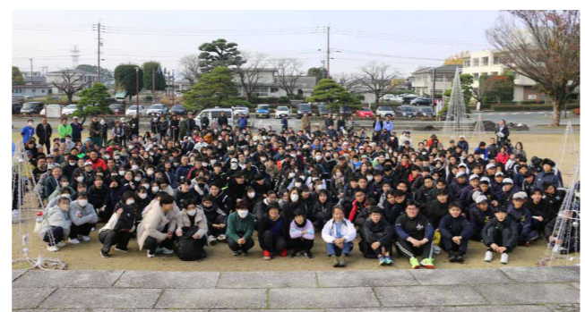
毎年、「城山の日」と称して清掃ボランティア活動を行っています

毎年開催している秋の「城山の日」清掃活動を実施しました。菊池公園や市民広場一帯を1時間半かけて約500人で清掃。ごみ拾いや落ち葉掃き、カズラ取りなどを行い、早朝から額に汗を流しました。