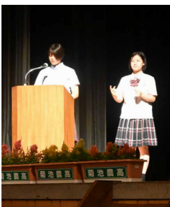
高校生による司会、手話通訳