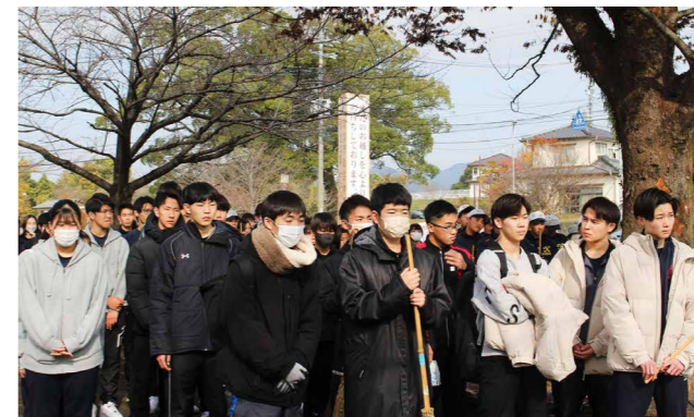
148人の生徒が清掃ボランティアに参加しました