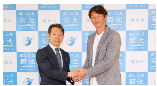
巻誠一郎さん(左)。九州・熊本の少年サッカーの発展とレベル向上や海外・県外チームとの交流を目的に、12歳以下を対象に開催されます

NPO法人ユアアクションクマモトが主催する少年サッカー国際大会の開催が、来年4月に大津町と本市で予定されています。報告のため、元サッカー日本代表で同法人理事長の巻誠一郎さんが市役所を訪問し、意気込みを話しました。