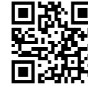
↑マチイロホームページ