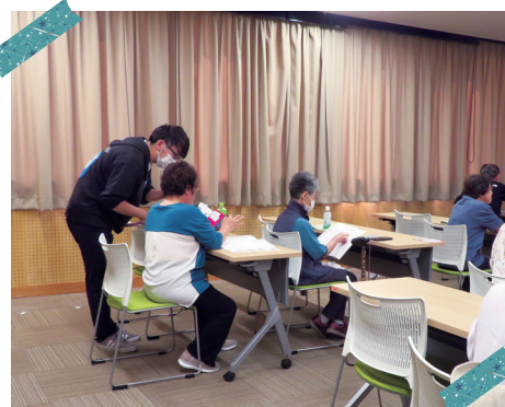
スマホ入門【アンドロイド編】(中央公民館)