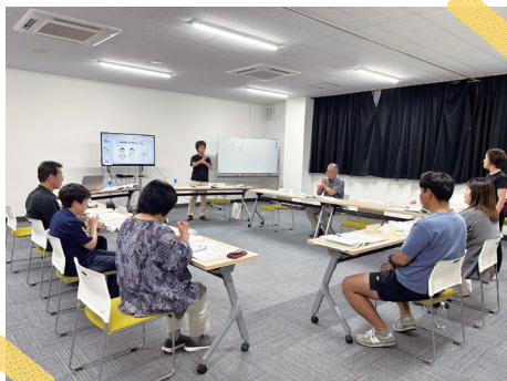
旭志手話サークル (旭志公民館)

対 象 ▶ 全市民 日 程 ▶ 7/9, 7/23, 8/6, 8/20 (全て木曜日) 時 間 ▶ 10:00～12:00 回 数 ▶ 全4回 定 員 ▶ 15人 場 所 ▶ 地域食材交流センター 受講料 ▶ 3,400円(材料費含む)