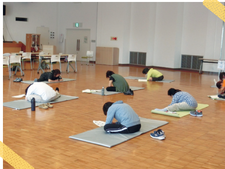
元気の学び舎 (旭志公民館)