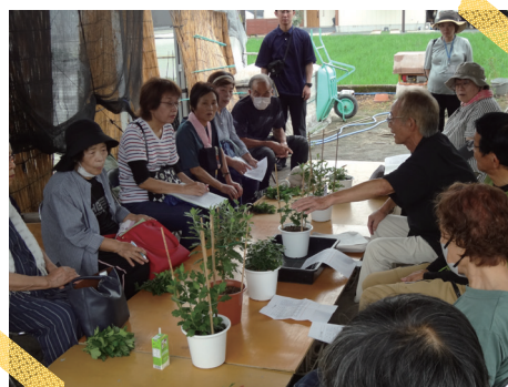
今年は菊の栽培に挑戦！！(泗水公民館)