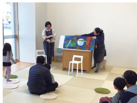
おはなし会 (中央図書館)