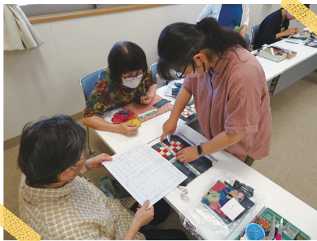
パッチワークキルトの小物づくり（泗水公民館）