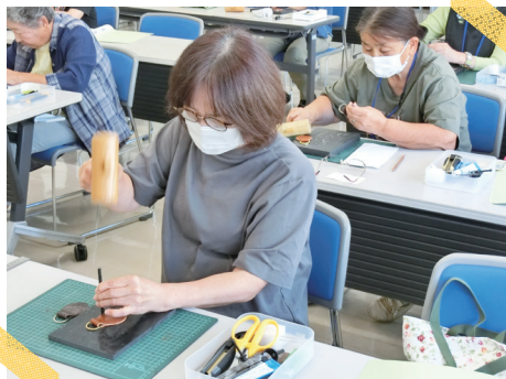
レザークラフトを楽しもう (七城公民館)