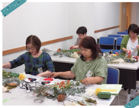
ドライフラワーで日本の季節を彩る (七城公民館)