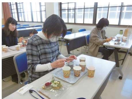
砂の芸術 サブルアート (七城公民館)