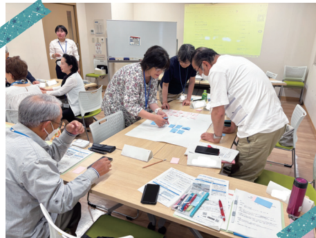
「デジタル」だって怖くない! (中央公民館)