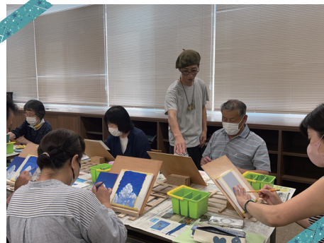
リアルに描くアクリル絵画講座 (中央公民館)