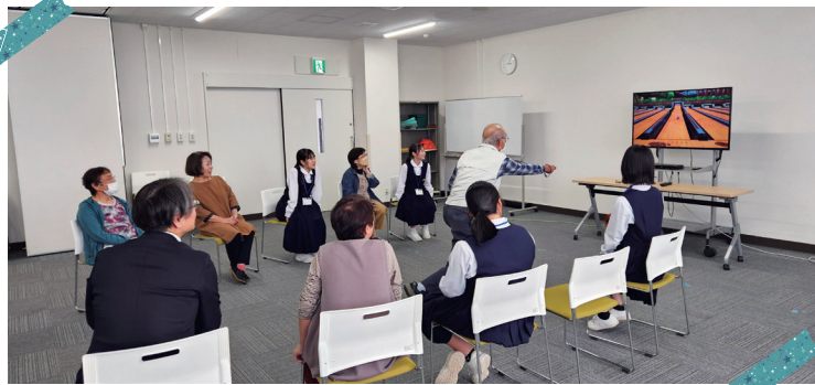
テレビゲームでフレイル予防！（旭志公民館）