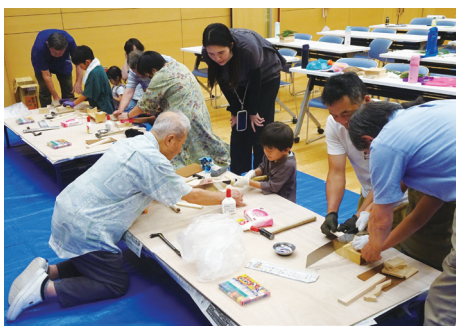
自然の木に触れて感じてみよう (泗水公民館)