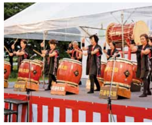
昨年のホテルフェスタ(円通寺太鼓)