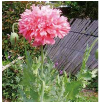
ケシ（ソムニフェルム種）

県では、4月～5月にかけて、「不正大麻・けし撲滅運動」を行っています。大麻の栽培は法律で禁止されていますが、日本全国で不正栽培により検挙される事例が後を絶ちません。ケシの仲間は色鮮やかで美しい花を咲かせるものが多く、人気があります。しかし、この中には麻薬の原料になるものもあり、法律で栽培が禁止されているものがあります。植えてはいけないケシ