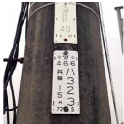
電柱に表示されている番号

119番を火事や病院の問い合わせに使用しないでください 緊急回線である119番での通報の中には「歯が痛いんですけど、ど