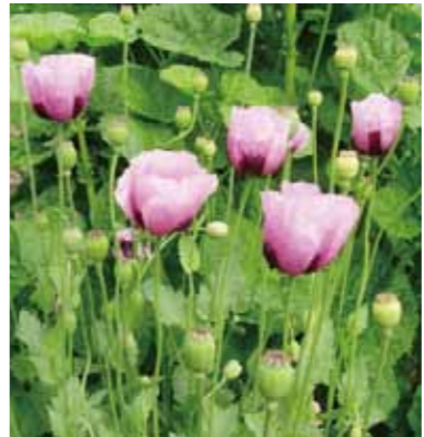
アツミゲシ（セティゲルム種）

浄化槽の大きさは建物の用途・大きさで決まっています。建物の用途を変更したり、増改築したりした際は、浄化槽の大きさを変更しなければなりません。