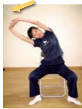
足を肩幅に開き、両手を組み、胸をはって天井に向かって伸ばし、顔は正面を向いたまま横に倒します。

この体操は、筋力・バランストレーニングを実施した後に行います。次の日に疲れを残さないことや、筋肉を痛めないために大切です。心と体を落ち着かせ運動後の爽快感を味わう、大切なリラクゼーションのための体操でもあります。 この体操をする時は、10数えながら行います。伸ばしている筋肉を意識して行います。