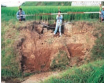
平成13年に起きた農地災害

※①・②どちらかの事業で復旧を希望する場合は、各区長さんの取りまとめになりますので、災害発生後3日以内に災害個所の属する区長さんへ連絡してください。その後、現