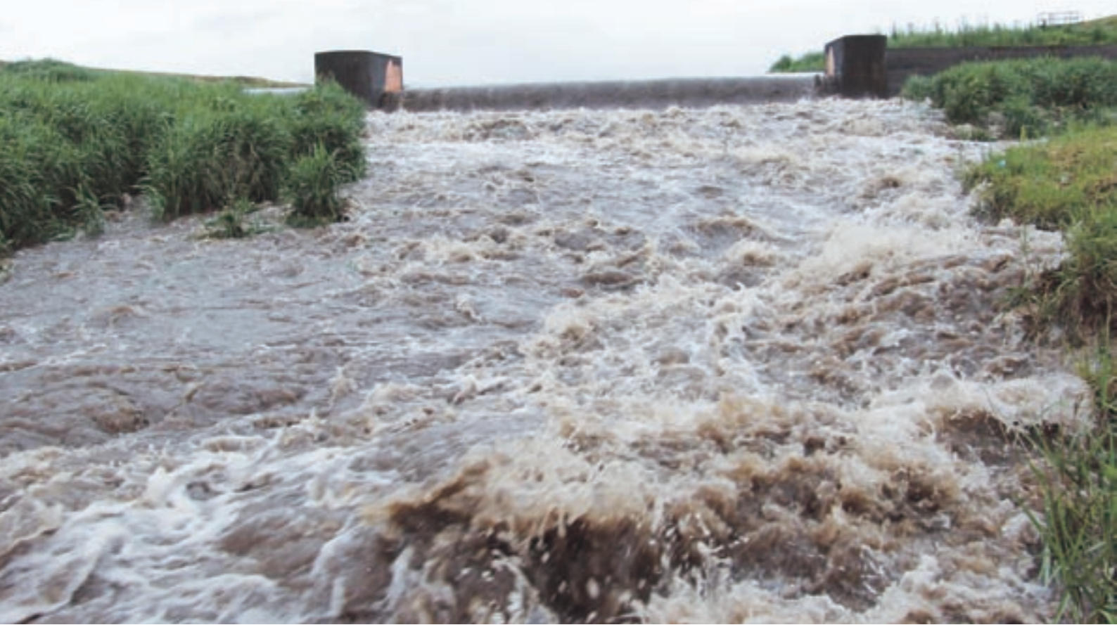
慣れ親しんだ川でも、集中豪雨などでいったん猛威を振ると、その威力は計り知れません