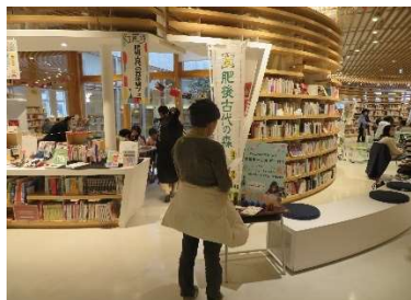
（写真は令和6年度キクロスまつりの様子）