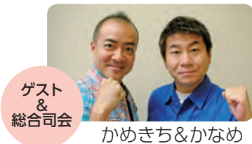
ゲスト & 総司会