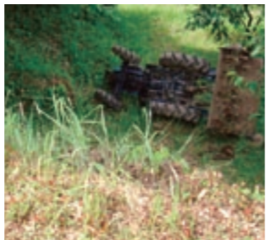
路肩から横転したトラクターの事故

○一人で作業をする場合は、どこで作業をしているかが家族に分かるよう、メモなどを残しましょう。