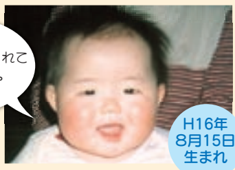
H16年 8月15日 生まれ