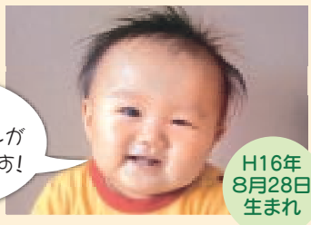
H16年 8月28日 生まれ