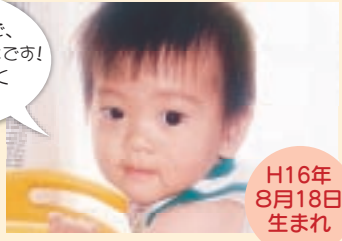
H16年 8月18日 生まれ