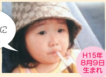
H15年 8月9日 生まれ