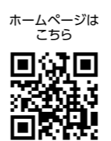
ホームページはこちら

確定申告会場への入場には「入場整理券」が必要です 次のいずれかの方法により整理券を取得してください。 ※作成済の申告書を提出する場合は「入場整理券」は不要 1 会場での当日配付 午前8時30分より、菊池税務署の1階にて入場整理券を配付します。配付状況によっては、入場まで数時間お待ちいただく場合があります。 2 オンライン事前発行 国税庁LINE公式アカウントを友達に追加し、トーク画面の「相談を申し込む」を選択することで手続きできます。 スマートフォンを使って便利に申告書を作成し、e-Taxで申告することが出来ます。確定申告時期の相談会場は、例年、大変混雑します。場所を選ばず申告できるe-Taxの利用をお願いします。 詳しくは、ホームページをご覧ください。お問い合わせください。 ☎菊池税務署 ☎(25)2121 ※自動音声案内で「2」を選択