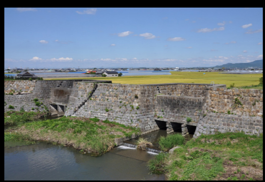
旧玉名干拓施設 (玉名市)

二千年にわたる開墾の歴史 (中世〜現代) 中世以降、山間では、溜め池造成や水路建設などの農業土木技術の向上によって、菊池川流域でも井手(用水路)が整備され、それまで水が届かなかった高台が水田に変わりました。江戸時代になると測量技術や土木技術がさらに向上し、各地に長距離の井手を通されました。全長11kmの「原井手」(菊池市は、延べ454戸ものマップ(水路トンネル)を手作業で掘り進め、水田を作るのが難しかった山地に棚田を拓き、米作りを可能にしました。「原井手」は300年以上経った今も現役で、地域の棚田を潤しています。番所地区の棚田は、急峻な山の斜面を切り拓き石積みを組み込んだものですが、集落内の住宅なども石積