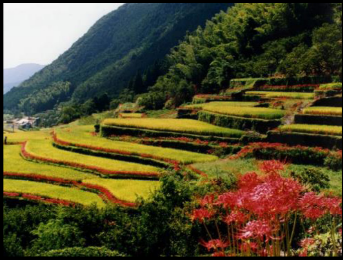
番所の棚田 (山鹿市)