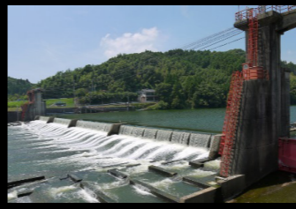
白石堰 (玉名市・和水町)