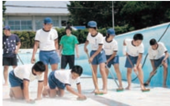
菊池市営プールの掃除をする菊池南中学校の生徒たち

菊池市営プールのオープンを前に菊池南中学校の1年生から3年生の男子生徒約240人がプール掃除をしました。