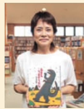
うちのえんさん (四) 桜山四