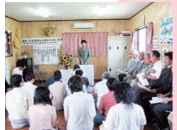
菊池ひまわりの会作業所であったNPO法人として1回目の総会

菊池ひまわりの会の総会が菊池市野間口にある同作業所であり、関係者など約30人が出席しました。