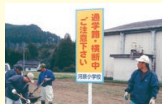
河原小学校の通学路に設置された標識

作業に参加した人は「この標識を見たドライバーがスピードを落とすなどして安全運転を心がけてくれればいいですね」と話されました。