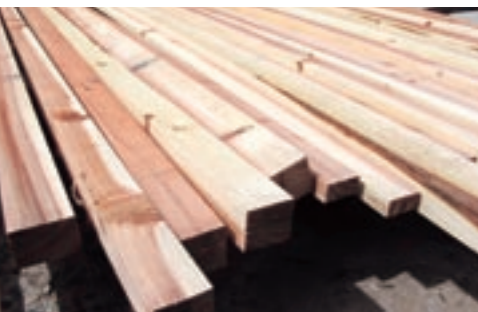
木造住宅を新築する人に乾燥スギ柱材を無償でプレゼントします

※参加希望の場合は、事前申し込みが必要です。 問い合わせ・申し込み先 熊本労働局雇用均等室 ☎096(352)3865