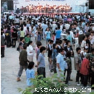
たくさんの人で賑わう会場