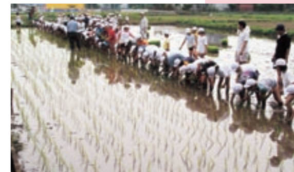
学校近くの水田で支援米の田植えをする隈府小学校の児童たち

隈府小学校と花房小学校の児童たちがアジア・アフリカの飢餓で苦しんでいる人たちに「少しでも手が差し延べられたら」と支援米を送るための田植えをそれぞれしました。