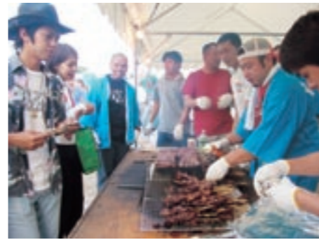
旭志物産館出資組合の旭志牛の串焼き

参加した生徒たちは「腰が痛いけど、みんなでするので楽しいです。市民の皆さんにも気持ちよく使ってもらいたいです」と汗を流しながら話してくれました。