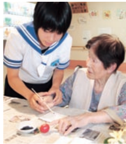
お年寄りに手を添えながら絵手紙作成の手伝いをする生徒

参加した生徒は「耳元でゆっくりと話しながら自分の意思を伝えました。交流できてよかったです」と話してくれました。