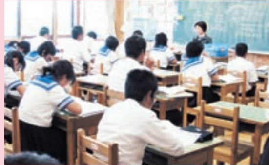
菊池北中学校であった「男女共同参画社会」の出前講座

未来を担う中学3年生が自分の将来を「性別にとらわれ過ぎず、自分らしく働く」という視点で考えてくれたらと思います。