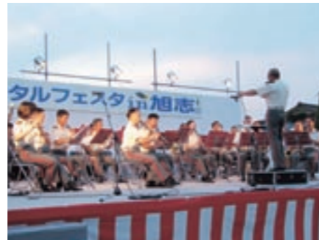
陸上自衛隊第8音楽隊の演奏

さつ。特設ステージで旭志小学校の児童たちが「なまはたから」などを元気よく歌いイベントが始まりました。エンゼルストレッチの踊りやイロソジョビ合唱団の合唱、旭志少年少女合唱団の歌、ほたる娘の踊り、菊池雲上太鼓が次々と披露され、会場からは拍手が起きていました。イベントのメイン、陸上自衛隊第8音楽隊が登場し、四季の歌のメドレーやテレビCMオンパレード、ホタルセレナーデなど十数曲を演奏すると、すばらしい音色と歌声に会場からは大きな拍手が送られました。福岡県から来たという親子は「たくさんイベントや出店もあって楽しいです。近くの川であんなにたくさんホタルを見たのは初めてです」と話されました。会場には商工会や旭志青年団