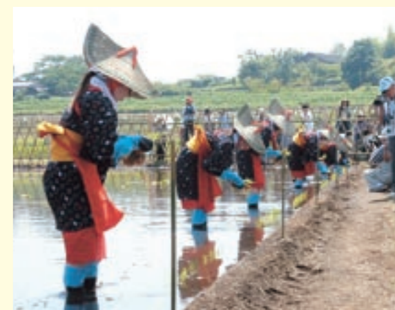
稲の苗を一つ一つ丁寧に植える早乙女たち

4月23日の「清祓祭」、5月9日の「播種祭」に続く献穀事業「御田植祭」が、菊池市鍋倉区の献穀神田でありました。