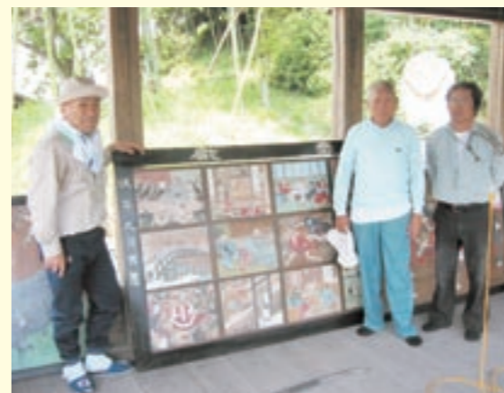
修復が終わった岩本菅原神社の絵馬

菅原神社は寛文4年(1664年)の創立とされ、近くにはシャクナゲで有名な円通寺や清水がこんこんと湧く泉があります。