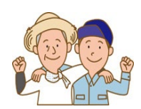
非常時の協力体制の構築