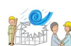
自力施工体制の活用等による災害復旧の取組実証