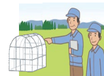
ハウス自力施工研修など技能習得