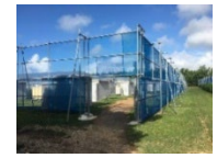
防風ネットの設置