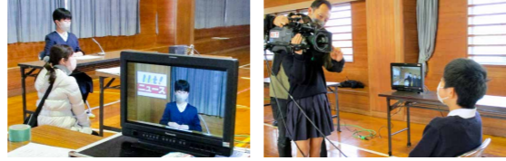
本物のスタジオさながらの雰囲気の中、生徒たちはアナウンサーになりきって原稿を読んだり、撮影したりしました

6年生が総合的な学習の時間に、熊本県民テレビの出前授業でテレビ局の仕事を体験しました。テレビ局で働くスタッフやアナウンサーの指導の下、テレビカメラや音声、照明などの機材を使ったり、カメラの前で原稿を読んだりしました。中継車の中まで見学することができ、児童たちは興味津々でした。