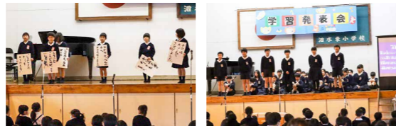
1年生⑥は1年間でできるようになったこと、5年生⑥は環境と水俣病について学んだことを元気いっぱいに発表しました

児童や保護者が集っての学習発表会を3年ぶりに行いました。当日は低学年と高学年の2部制で実施し、多くの保護者が来校。体育館がいつもと違う緊張感と期待感に包まれる中、どの学年も立派に学習の成果を発表しました。発表後はたくさんの温かい拍手を受け、児童は満足感で一杯のようでした。