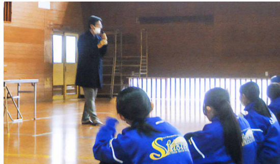
先生のプレゼンを使った分かりやすい説明を真剣に聞き、意欲的に質問する姿が印象的でした。

菊池中央病院と劇団くらだけより講師の先生をお迎えし、1年生が「認知症サポーター養成講座」を受講しました。講義や質疑応答の後、生徒たちはサポーターの証であるオレンジリングを受け取りました。この学びを日常生活の中で生かしてくれることを期待しています。