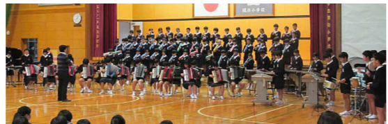
6年生が披露した「情熱大陸」。アコーディオンや鍵盤ハーモニカ、リコーダーなど、爽快な音色が体育館に響き渡りました

3年ぶりに学習発表会を開催しました。各学年が、自分が成長したことや菊池一族、白龍祭りなど菊池に伝わる文化や、市の福祉、環境について工夫して発表。6年生は修学旅行で学んだ平和や人権のことについて自分自身と重ねて発表し、「情熱大陸」の合奏をしました。