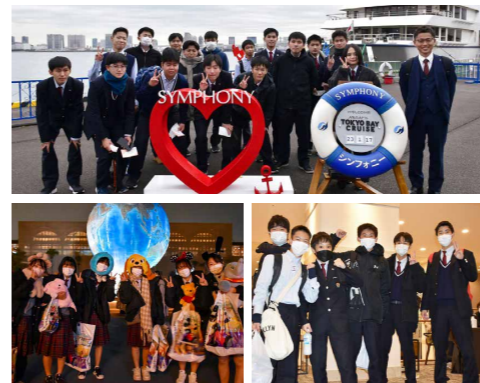
たくさんの思い出を作ることができた貴重な4日間でした