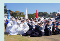
昨年の菊女フェスタ