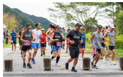
【LAST DRAGON ULTRA】1周約6kmのコースを1時間以内に走り、スタートから1時間後に再びスタートするレース。西日本では竜門ダムのみ開催

「生まれ育った場所だから、いつまでも人の集まる場所にしたくない」。ふるさとの明かりは次の世代に受け継がれています。