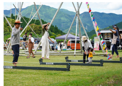
【KIKUCHI CAMP】アウトドアショップ「WOODS菊池店」と共催して行うキャンプイベント