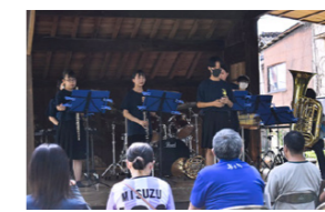
吹奏楽部は菊高前の菊池松籬子能場で演奏