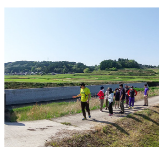
参加者からは「里山の豊かな自然に触れ、心も体も癒やされました」といった声がありました

午後のコース(所要時間…2時間)は、旭志の里山を歩きました。湧水あふれる伊萩区の杉井川水源で涼しい空気を浴びたり、高台にそびえる伊萩二宮神社からの絶景を見たりしました。その後、住民の人が大切に育てた花で彩られた庭を見学。最後に岩本区まで歩き、円通寺のシャクナゲを観望しました。