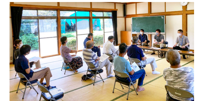
各区長をはじめ、多くの住民が参加。「空き家に対する認識が変わった」「空き家に対する理解が深まった」などの声が聞かれました

花房小学校区で空き家に関する勉強会を開催。市が行う出前講座の一環で今年度から実施しています。「なぜ空き家をそのままにはいけないのか」や「市空き家バンク制度」など担当職員が説明。その後参加者と意見交換を行いました。