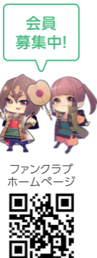
ファンクラブホームページ

この漫画は菊池武光の生涯を、子どもたちにも気軽に学んでもらおうという目的で制作され、市内外の小中学校へ配付を予定し