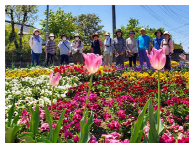
玉祥寺花明かり会は、花いっぱい地域づくりを続けており、県や市が実施した景観に関するコンクールで賞を受賞しています

スプリングウォークのテーマは「花咲き誇る菊池の春」。新型コロナウイルス感染症防止対策を徹底し実施しました。