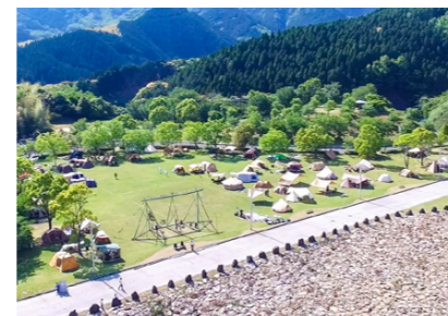
今年のゴールデンウィークは100張を超えるテントがキャンプ場に集合。県内外から多くの人でにぎわった