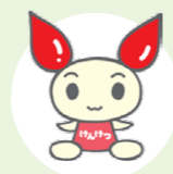
献血推進キャラクター けんけつちゃん

とき 11月15日(火) 午前9時30分～11時 午後0時15分～4時 ところ 旭志村ふれあいセンター道の駅 旭志 内容 400ml 献血