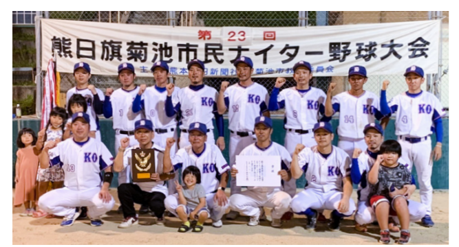
3年ぶりに優勝したKOOBクラブのメンバー

菊池公園多目的グラウンドで開催され、9チームが頂点を目指しました。開催期間中は悪天候が続きましたが、出場選手たちは白熱した試合を繰り広げ、KOOBクラブが5回目の優勝を飾りました。準優勝は水源クラブでした。