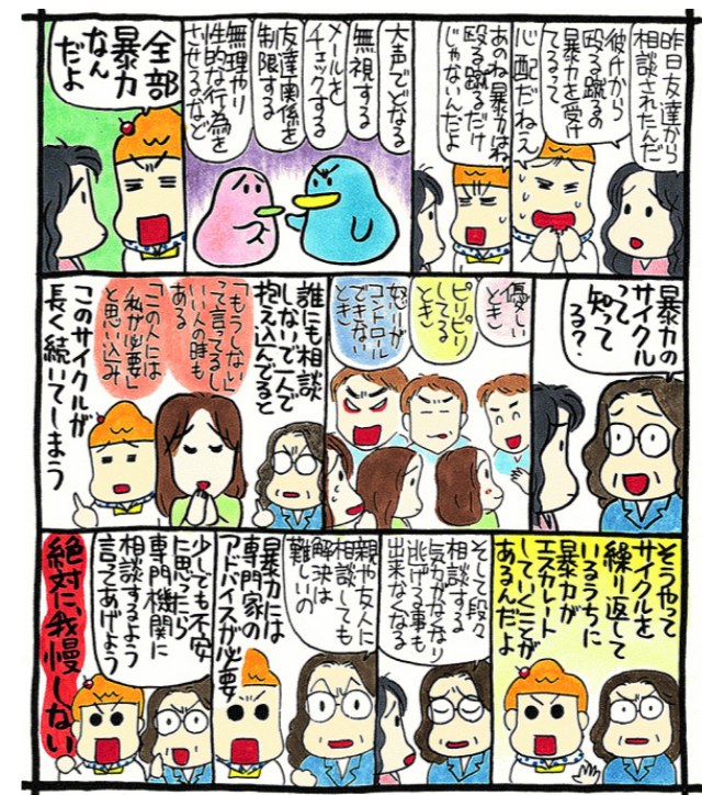
内閣府男女共同参画局「女性に対する暴力をなくす運動」描きおろし漫画

あなたは、パートナーとどういう関係を築いていますか。安心して意見を伝え合い、相談できる関係はできていますか。嫌なことは「NO」と言えますか。相手からの「NO」をきちんと受け入れ、お互いに相手を尊重できますか。あなたは、一人ではありません。一緒に考えてくれる専門の相談窓口があります。相談してみること、気付かなかった解決方法が見つかるかもしれません。 【DV相談ナビ】#8008