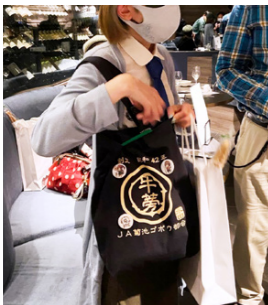
JA 菊池の牛蒡トートをご愛用の参加者

関東近郊のファンの人に、もっと菊池を身近に感じてもらうと5月4日にグルメ交流会を開