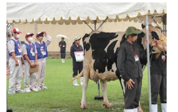
家畜審査競技プレ大会(7月)