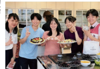
楽しく調理できました

● 2学期のユニーク講座紹介 9月4日、運動と認知トレーニングを合わせた、認知症予防運動プログラム「コグニサイズ」の講座を行いました。株式会社より、認知症の仕組みや脳の活動を活発にする方法などを教わり、コグニサイズを行いながら、たくさん笑って脳を活性化しました。 この学習を通して生徒たちは、10月7日に福岡で行われた「ふくおかカイゴつながるプロジェクト」へ参加。「カイゴを快楽へ」という魅力的な学びを得ました。今後も「菊女スマイルお元気プロジェクト」を発信していきます。 9月29日には、菊池在住のベトナムの人と、料理を通して国際交流会を実施。ベトナム風フルーツゼンザイ「チュー」を教えてもらいながら一緒に作ったり、言葉や文化を学んだりしました。今後は、フィリピン、韓国、ドイツの人たちとの交流も予定しています。 ● 菊女奇跡の物語 7月から行方不明になっていた保護猫ミラクルチャッピーが77日ぶりに帰ってきました。生徒も地域の人も含め、たくさんの方が心配して情報を寄せてくださいました。本当にありがとうございました。 ● 菊女奇跡の物語 7月から行方不明になっていた保護猫ミラクルチャッピーが77日ぶりに帰ってきました。生徒も地域の人も含め、たくさんの方が心配して情報を寄せてくださいました。本当にありがとうございました。