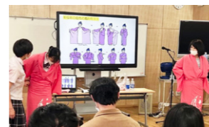
着付けを通して和文化を伝承