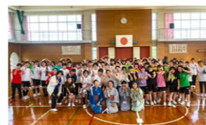
体育館で盆踊りのレクチャー