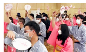
みんなできくち女子舞

多文化共生を目的に菊池市立図書館と合同で、市内で働く外国人を招き、本校で交流会を行いました。多くの人が参加し、生徒から反響帯の着付けを学んだり、きくち女子舞と一緒に踊ったりして楽しいひとときを過ごしました。次回は12月11日(日)、茶道を通じた交流会を行う予定です。