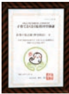
登録証とステッカーが交付されます