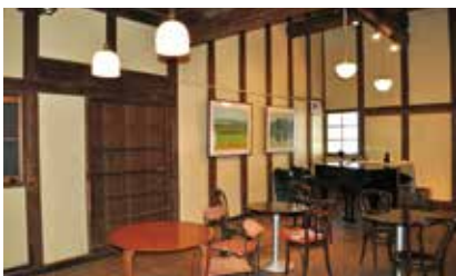
↑演奏会や展示会が行われているホール