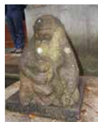
↑玄関前にあるサルとカエル石像