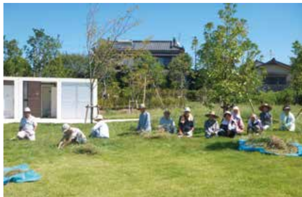
除草ボランティアに参加した会員の皆さん

参加した会員の皆さんは、和気あいあいと作業を実施しながら「公園を訪れる人に気持ちよく利用してもらえたら」と思いを語りました。