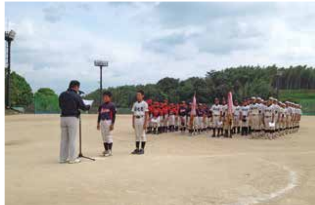
子どもたちは 2 日間にわたり熱戦を繰り広げました

今大会では、熊本県トラック協会菊池支部から最優秀選手賞・参加賞などが選手に贈られ健闘を称えました。