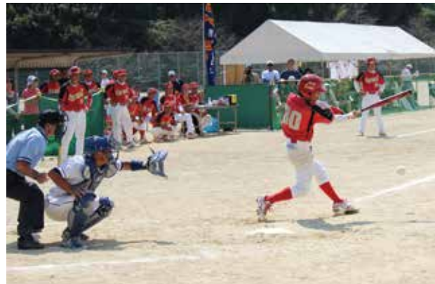
決勝戦で攻撃中の三友クラブ

優勝 三友クラブ(熊本県) 準優勝 鳴門クラブ(徳島県) 第3位 旭化成フィフティーズ(宮崎県)、厚木クラブ(神奈川県)