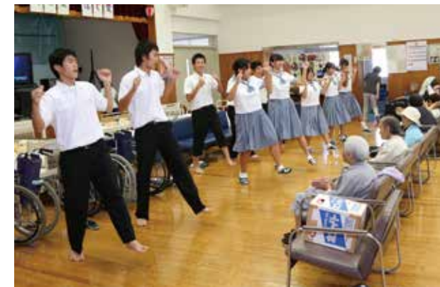
老人福祉施設で高齢者に踊りを披露する生徒たち

老人福祉施設を訪れた生徒たちは、利用者の皆さんと一緒に神経衰弱を楽しんだり、踊りを披露したりして交流。その後は施設にある車いすの掃除やタイヤの空気入れなどを行いました。