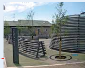
横町ポケットパーク