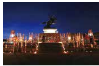
昨年のほの宵まつり