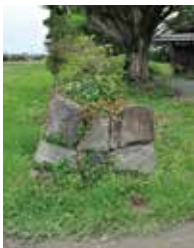
↑地表に見える石垣