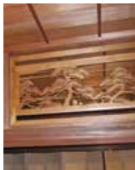
↑透かし彫りの欄間

この母屋は住宅として建てられたものですが、飲食店を経営していたこともあってか、客をもてなすための豪華な内装が施してあります。その主な特徴は、2階座敷の付け書院、透かし欄間、回り廊下と、2階にある2部屋それぞれに階段が設けられている目的があったと考えられます。現在はNPO法人「菊池まちづくり千年の風」の活動本拠地として、会合・講演会や企画展示会などに活用され、人々の集いの場となっています。