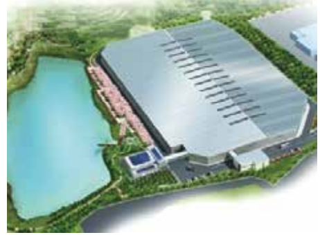
最終処分場イメージ

各総合支所の問い合わせ先 七城総合支所 ☎0968(25)1000 旭志総合支所 ☎0968(37)3111 泗水総合支所 ☎0968(38)2112