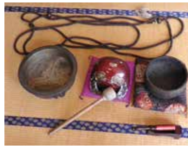
認定番号第ふるさと H24-16号 推薦者 村田区

専用仏具は直径2.5mの大数珠のほか、打ち鉦、木魚、鐘があり、打ち鉦には安永8年と刻まれています。230年以上前から、この地で大切に引き継がれてきた行事と仏具であることが物語っています。