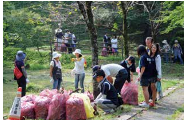
子どもから大人までたくさんの人がごみ拾いなどに汗を流しました

菊池観光協会主催で菊池公園一帯の清掃活動が行われました。これは城山地区の再生プロジェクトの一環として毎年行われているもので、市内外から 200 人を超える参加者が集まりました。参加者は約 1 時間半ごみ拾い、園路清掃や桜の木への肥料やりなどを実施。45ℓのごみ袋 400 枚分のごみや落ち葉が集まりました。作業後は菊池市民広場で「梨カレー」や菊池の天然水などが振る舞われ、きれいになったまちを眺めながら舌鼓を打ちました。