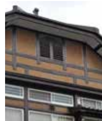
↑ハーフティンバー風の外壁