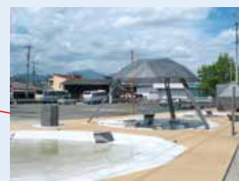
切明ポケットパーク