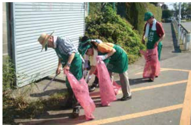
ごみ拾いを行う組合員の皆さん

参加した組合員の皆さんは、沿道に落ちているたばこの吸い殻や空き缶などを拾いながら額に汗を流しました。