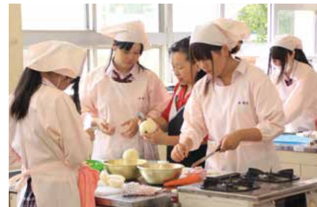
講師に包丁の使い方を習いながら調理する生徒たち

この梨カレーは翌日開催された「第 4 回城山の日」に無料で振る舞うために作られたもので、この日は主に皮むきなどの下ごしらえを実施。生徒たちは慣れない手つきながらも、講師の指導を受けながら約 250 人分の梨カレー作りに励みました。今回使用したステビア栽培の果物は、栄養が豊富で昔懐かしい濃厚な風味があるといわれています。