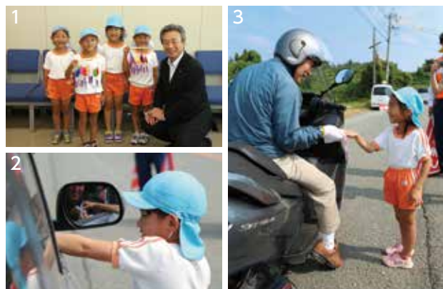
1. 市役所を訪れた園児たちと木村副市長 2,3. 園児たちはドライバーの皆さんに笑顔添えてお守りを渡しました

その後園児たちは、菊池警察署の協力のもと、国道沿いでドライバーにお守りを配布。明るい笑顔を振りまきながら安全運転を呼びかけました。