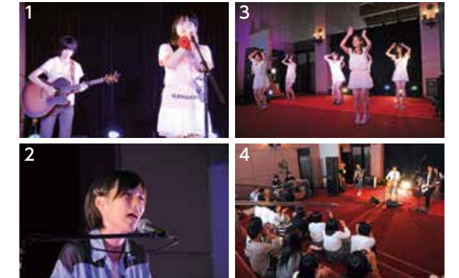
1,2. 女子学生の弾き語り 3. 女子学生ユニットによるダンス 4. 男子学生のバンド演奏で盛り上がる観客

約 2 年ぶりの開催となる今回は、弾き語りやバンド演奏、ダンスなど 6 組が出演。イベントの復活を心待ちにしていた大勢の観客を前に、全力のパフォーマンスで盛り上げていました。