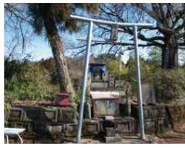
認定番号第ふるさと H24-15号 推薦者 今区

真下を流れる菊池川に敬意を表してか、元々はインドで流れる川を神格化させた神サラスヴァティー、日本では七福神の一人で、福徳付与の神である「弁財天」(弁天様)様が祭られています。