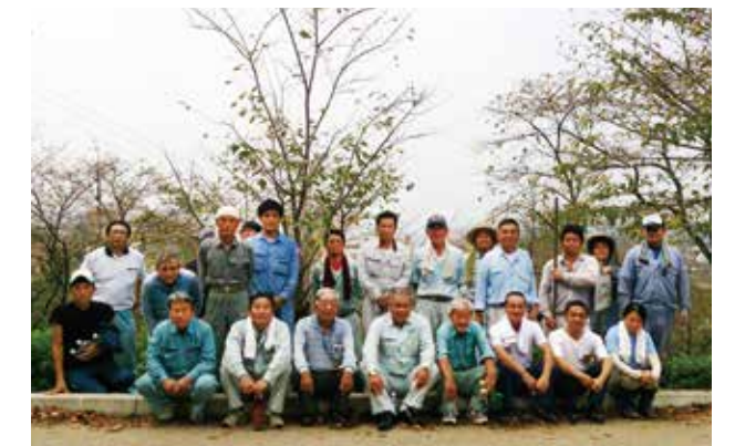
菊池市建設業協会と菊池市造園業協会会員の皆さん

菊池市建設業協会と菊池市造園業組合の皆さんが、菊池公園内にある桜の根元に穴を開けるボランティア作業を実施しました。この作業は 9 月 14 日開催の「第 4 回城山の日」で、桜の木への肥料やりを効率良くできるようにするために行ったものです。菊池公園城山地区の桜は、開園当時のものが多く老木化が進んでいます。その現状を多くの人に知ってもらいたいという思いから、桜の木への肥料やりが行われることになりました。