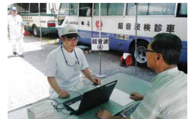
専用車両で行われた腹部超音波検診

期間中は6千人を超える市民が受診。さまざまな健診を受けながら体の点検を行いました。健診担当の職員は、「健診は病気の予防や早期発見につながる大切な機会。年に一度は必ず受けてほしい」と話していました。