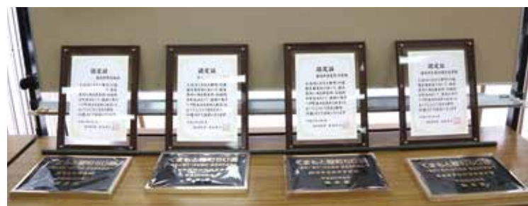
くまもと歴町50選の認定証とプレート。菊池市隈府地区、築地井手界隈、赤星井手界隈、弁利円通寺道界隈の4カ所が選定されました

建築後50年で登録対象となり、地方自治体からの情報を基に国が候補を選定。文化審議会の答申を経て登録されます。登録後は固定資産税の減税などの優遇措置を受けることができます。平成17年からは工芸品も対象になりました。