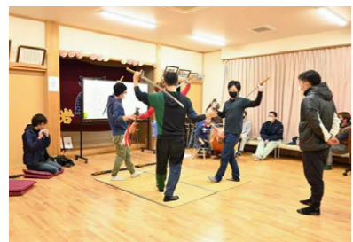
継承式に向けて練習。当日は雪の舞う中、地元の人だけでなく県外からも観客が訪れ、19代目の舞を見守りました