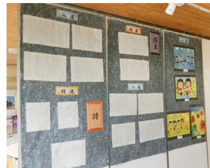
市内各公民館でも巡回展示を行いました

また、市内の各公民館で巡回展示をした際にも、たくさんの人にご覧いただき、感想も多数寄せられました。一部を紹介いたします。