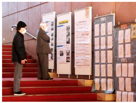
受賞作品を文化会館ロビーで展示

受賞作品の紹介は今回で終了です。フェスティバル当日は、文化会館ロビーにて多くの人が鑑賞し、「孫の作品が受賞したから見て来た」とうれしそうに話す人もいました。