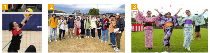
1. 社会人9人制バレーボールでは全国大会に出場した 2. せいかいかいぎのメンバーと。昨年度は市内イベントに出店し、それぞれの国の郷土料理を販売 3. 「きくち盆踊り」では市国際交流協会と協力して外国人に浴衣の着付けを行い、一緒に踊った