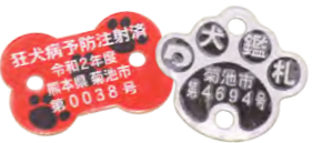
④犬の登録証明となる鑑札 ⑤狂犬病予防注射済票