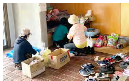
被災したペットの支援も行っている