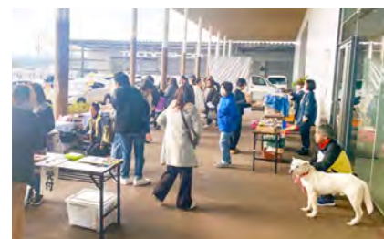
月に1回開催している譲渡会

「保護犬」という言葉が人をかんでしまったら、人間が一方的に怒るのではなく、「なぜ、かむのか？」と疑問を持ち、原因を探ることが大切です。しつけや犬との接し方に問題はないのか、一方に犬が悪いと決めつけるのではなく、なぜ犬がこういう行動をとったのかを人間側が考える必要があります。犬と最新まで寄り添う覚悟を持って、共に暮らしていくために、人間も犬から学ぶ必要があるのです。 「保護犬」という言葉が社会からなくなすために。菊池っ子たちのために、自分たちができることをこれからも続けていきます」