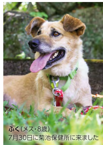
ふく(メス・8歳) 7月30日に菊池保健所に来ました