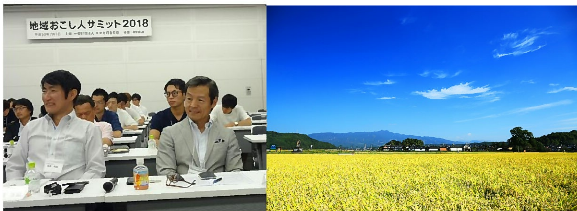
昨年の地域おこし人サミット 2018 の様子