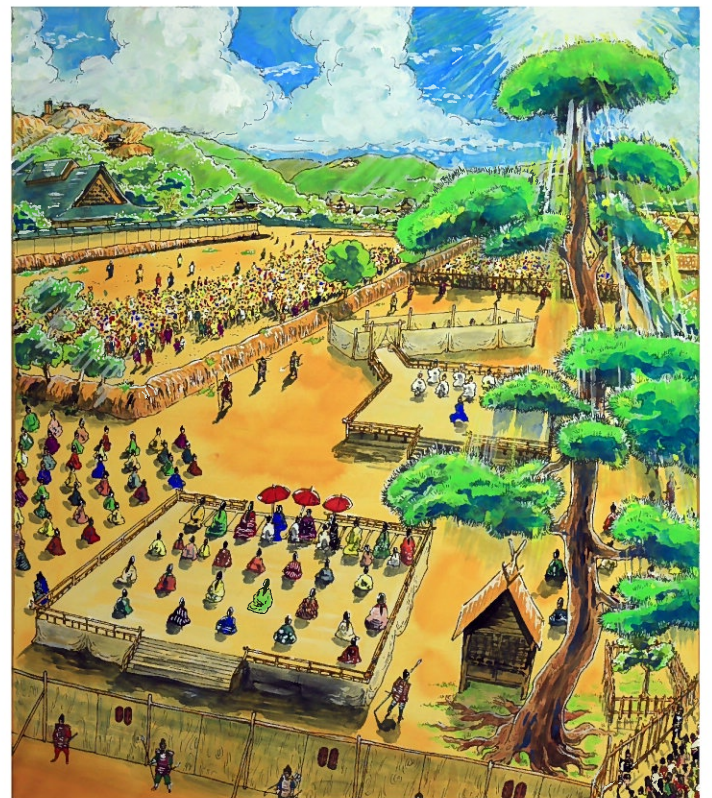
隈府の松囃子能場