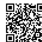
講座一覧のQRコード

https://www.pref.kumamoto.jp/site/agri-academy/79487.html (仮)