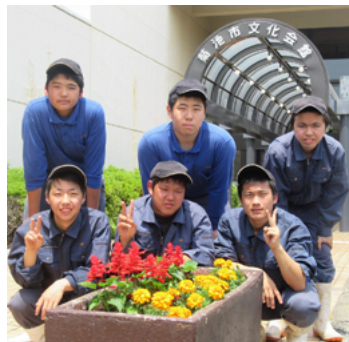
暑さにも強く、色鮮やかな花苗を植えました

品 種 マスカットベリー-A(種なし)、ピオーネ(種なし)、巨峰、その他 価 格 1kg、600円～1500円程度 販売開始 8月5日(月)～ 販売時間 (月)(水)(金)の午前10時～午後1時 販売場所 本校果樹園(車での来園も可) 連絡先 ☎0968(38)4546(本校果樹園)