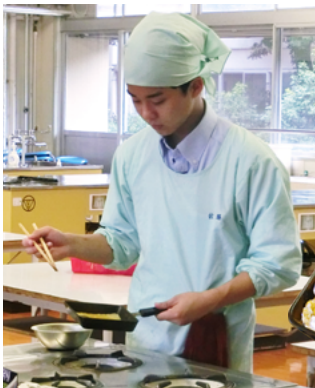
全員合格を目指して頑張ります

生活文化科では、これまで学んできた知識と技術を試す機会として、被服製作技術検定と食物調理技術検定に挑戦しています。 被服検定は、2年生が和服2級「じんべいの製作」、3年被服専攻生が和服1級「浴衣の製作」と、和裁の高度な縫製技術が求められます。 調理検定は栄養バランスを考えた献立作成や調理の技術が必要です。2年生が3級、食物専攻の3年生は2級に挑戦します。2級のテーマは「17歳女子のお弁当献立」。この夏、筆記と実技試験が行われます。 放課後も残って、技術だけでなく、丁寧さや正確さを磨いている生徒たちには、あきらめない精神力が育っています。