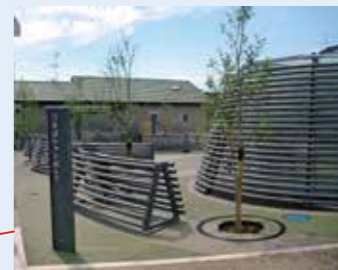
横町ポケットパーク