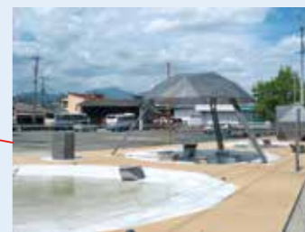
切明ポケットパーク