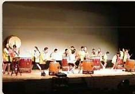
※写真は過去に実施したものです。