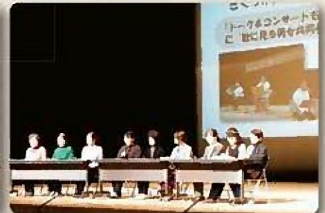
※内容につきましては、都合により変更になる場合がございます。