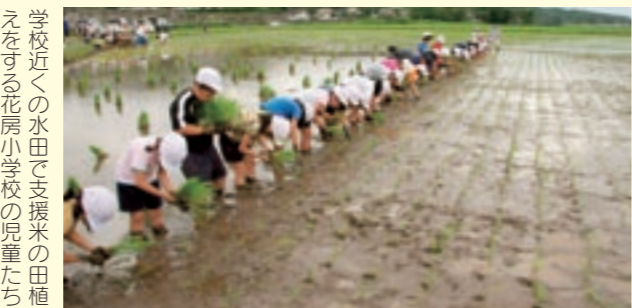
学校近くの水田で支援米の田植えをする花房小学校の児童たち

また、田植え後には、菊池市食生活改善推進員協議会の花房地区のメンバーなど8人が作った「田植え団子」が振舞われ、児童たちは伝承料理も楽しみました。