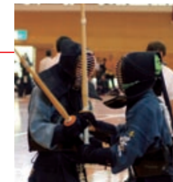
熱戦を繰り広げる選手たち