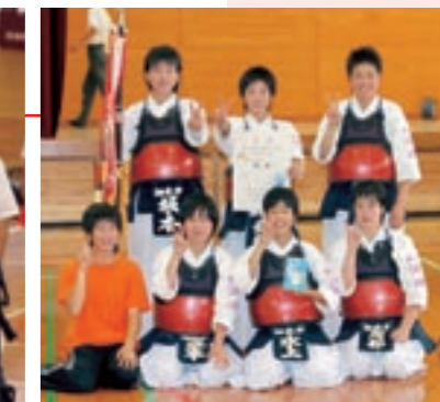
中学校女子の部で優勝した泗水中学校