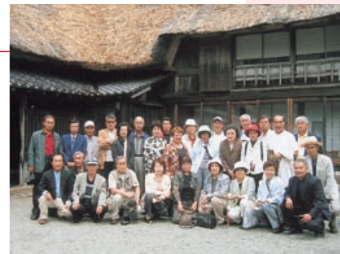
「千葉家の曲り家」を訪れた会員たち

菊池市と遠野市は、今年の4月8日に合併一周年事業の一環として友好都市の調印をし、市民団体などによる相互交流を行っています。