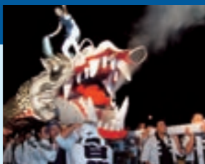
昨年の菊池白龍まつり