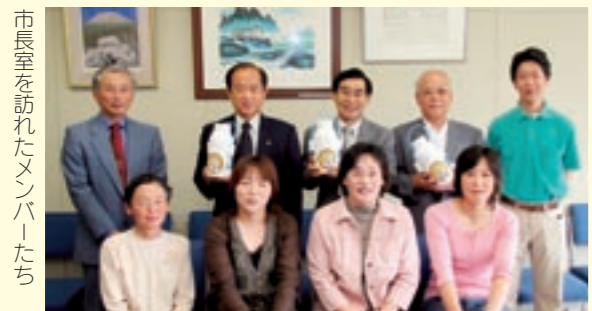
市長室を訪れたメンバーたち

訪れた6人は「お父さんたちに感謝し、たくさん牛乳を飲んでもらい、牛乳消費の落ち込みの解消になればと思います。そして、この活動が菊池地域のPRになることを期待します」と活動に取り組む抱負を話されました。