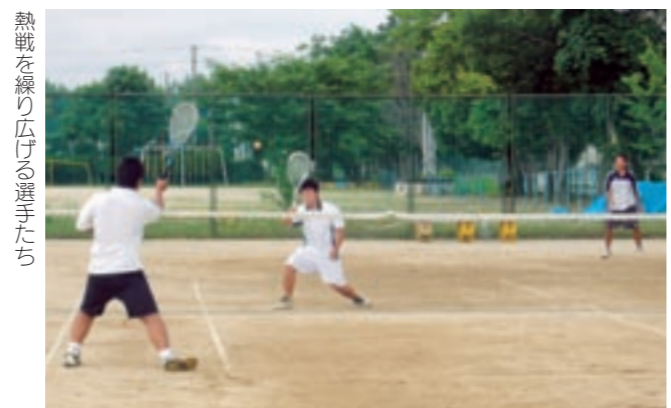
熱戦を繰り広げる選手たち