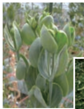
タバココナジラミ類 (体長1ミリ前後)