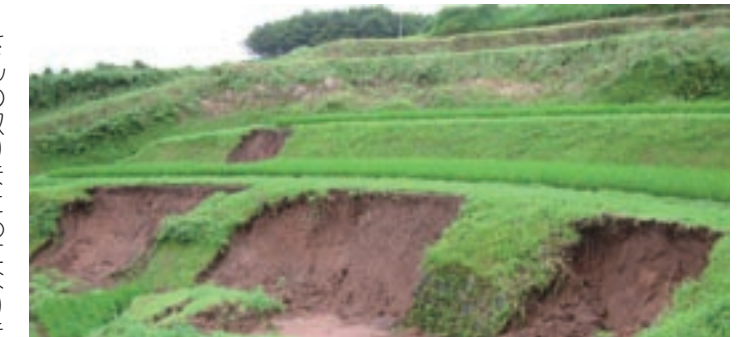
平成18年発生農地災害

さんの取りまとめになりますので、災害発生後3日以内に災害箇所の属する区長さんへ連絡してください。その後、現地確認などをして、申請書を提出していただきます。 なお、区長さんへの連絡は、次の事項について報告をお願いします。 被災箇所、被災種別（田・畑・農道・水路など）、被災規模（延長・高さ・幅など）、耕作者名、代表者名、電話番号 問い合わせ先 農林整備課農林工務係 各総合支所産業振興課