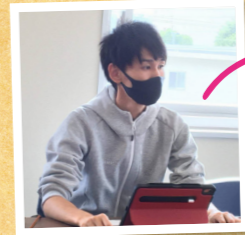
菊池への移住・定住を促進するオンラインイベントで移住者として登壇