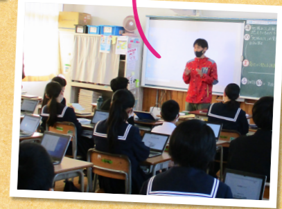
菊池南中学校の生徒に協力隊の活動について話しました

3月末で3人の隊員が3年間の任期を終え卒業します。12月号・2月号で、3人の隊員それぞれに、これまでの活動を振り返ってもらいます。