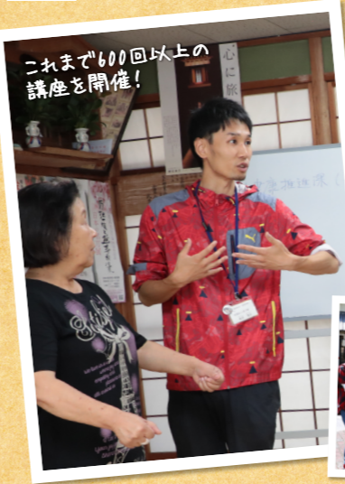
これまで600回以上の講座を開催!