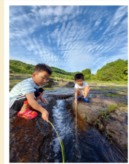
撮影場所・千畳河原