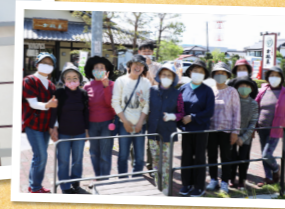
参加者の皆さんと楽しくウオーキング