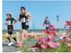
コスモスマラソン