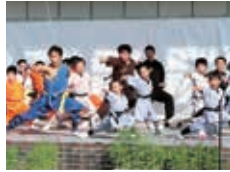
ステージイベント