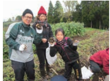
前回の菊芋収穫体験

体に良い野菜として、注目度上昇中の「菊芋」と「ヤーコン」。そんな菊芋とヤーコンの魅力をとっぴり体験できるツアーを企画しました。菊芋、ヤーコンの収穫体験のほか、ウォーキング、聖護寺での座禅体験、精進料理で心と体のデトックス体験しませんか。 とき 11月6日(日) 午前9時~ ところ 菊池市内 参加料 2千円、小学生以下千円 定員 25人(先着順)