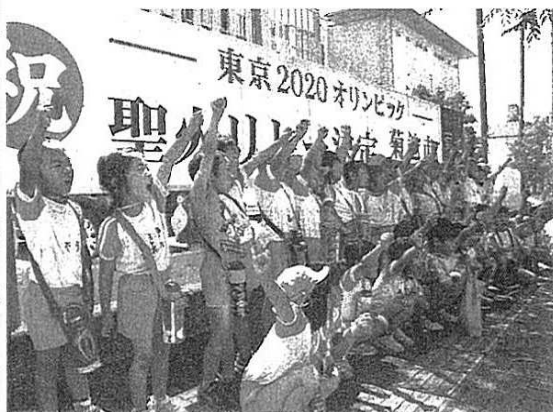
聖火リレーのルート決定を祝う園児たち＝菊池市

2020年東京五輪、火リレーの通過ルートになった菊池市は5月7日、市役所前に掲げたPR看板のお披露目会を開いた。看板は縦90センチ、横60センチ、火リレー決定を記した。看板は縦90センチ、横60センチ、火リレー決定を記した。看板は縦90センチ、横60センチ、火リレー決定を記した。