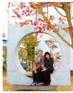
昨年できたラブベンチ(院の馬場ポケットパーク)

グランプリ受賞者には、ベンチ完成まで製作に係る監修をしていただきます。ベンチの作成費用が50万円以内であるため、作成に当たって意に添えない場合があります。発表後であっても不正が確認された場合は取り消す場合があります。 ㊟都市整備課都市整備係 ㊟(25)7242