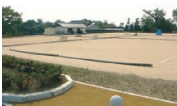
弓道場横に移転したゲートボール場

新緑の候、さわやかな汗をかき、健康の保持増進を図りませんか？菊池市ミニバレーボール協会では、市民の親睦、融和を図ることを目的とし、大会を開催します。皆さんの参加をお待ちしています。 とき 6月20日（金）午後6時50分開会 ところ 菊池市総合体育館 種目 ミニバレーボール競技 チーム編成 ○男子の部 49歳以下・50歳以上 ○女子の部 39歳以下・40歳以下 ○男女の部 60歳以上（女性チームにハンディを与える） ※男子の部に女子の参加は可とする。 参加資格 菊池市内に居住または、勤務する者。ただし、学生は除く。 参加費 1チーム1,500円。ただし、参加するには、協会の登録が必要です（登録料1,000円）。 申し込み方法 各支部の事務局で、6月10日（火）まで受け付けます。 ※申し込み用紙は、菊池体育センター、教育委員会旭志分室、泗水分室、旭志体育館、泗水B&G体育館などに置いてあります。 問い合わせ・申し込み先 菊池市ミニバレーボール協会 菊池支部（城） ☎(24)0630